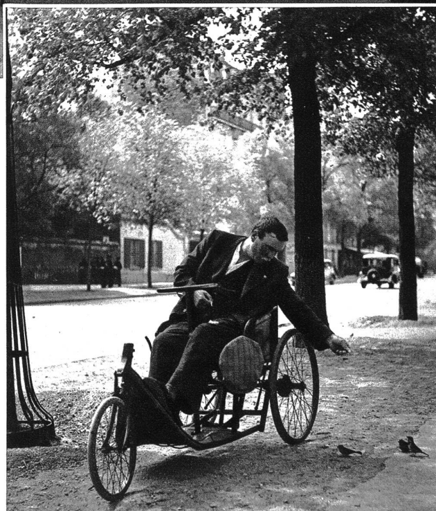
Mit einem Stück Brot in der Tasche fährt er nach dem Morgenessen aus dem Spitalhof, spricht mit Dienstmädchen u. füttert Spatzen.