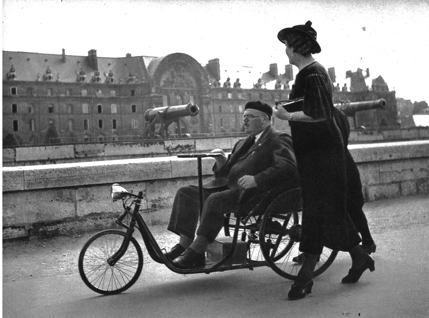
Aus dem Schützengraben brachten sie ihn von Lazarett zu Lazarett. Seit 1918 wohnt er im Invaliden-Spital. Bekannte besuchen den alten, gelähmten Krieger und führen ihn eine Stunde lang spazieren.

und eine einzige Feuerstunde könnten 7000 Mittagessen an Arme bezahlt werden. Vierzig Villen könnten gebaut werden mit dem Gelde, das ein Bombenflugzeug und dessen Munition für einen einzigen Flugangriff kostet. Ein Tank kostet ungefähr soviel wie man für zehn Traktoren aufzuwenden hat, die nützlicher Feldarbeit dienen. Rechnet man zusammen was für Werte verloren gegangen sind von 1914—1918 nur an versenkten Schiffen, so könnte man damit 166 der modernsten Lugusdampfer wie die Normandie bauen.