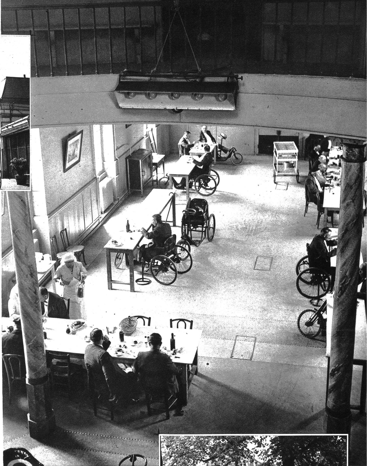
Vier Jahre lang lagen sie im Schützengraben, gemeinschaftlich wohnen und essen sie jetzt, eigentlich die, welche heute schon zur stummen Legion gehören.