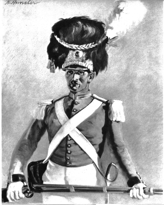
Herzogsgrenadier aus dem Löttschental.