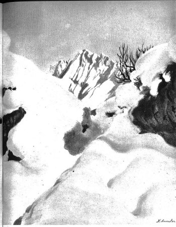
Winter im Löttschental.