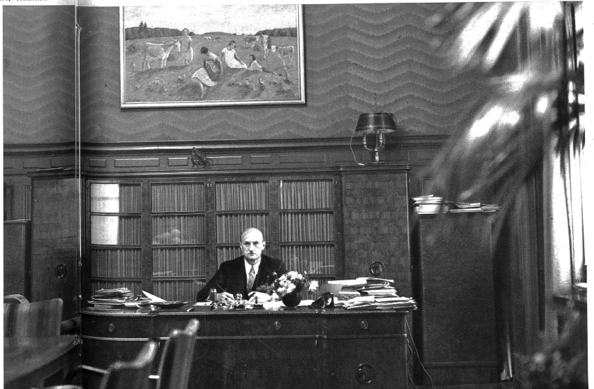
Bundespräsident Etter, Vorsteher des Departementes des Innern, in seinem Arbeitszimmer im Bundeshaus.

CLARUS Die vierte Klasse der Primarschule Mellingen im Jahre 1901. In der zweiten Reihe von unten der zweite von rechts, ist der 10-jährige Philipp Etter.