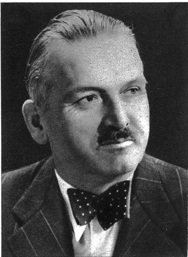
Dr. Henry Vallotton (St. Sulpice), der neue Präsident des Nationalrates