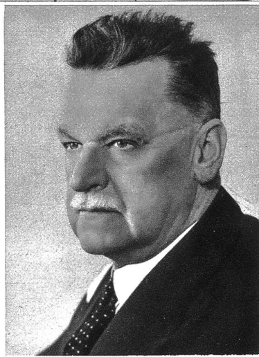
Ständerat Löpfe (Rorschach), Präsident des Ständerates