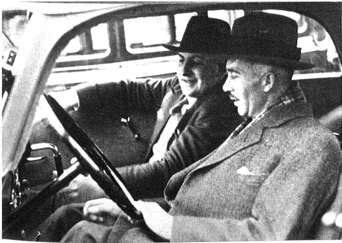
Die Probefahrt. Auf einer kurzen Fahrt wird sich der Käufer am besten von den Vorzügen des Wagens überzeugen und Mut zum Kauf kriegen.