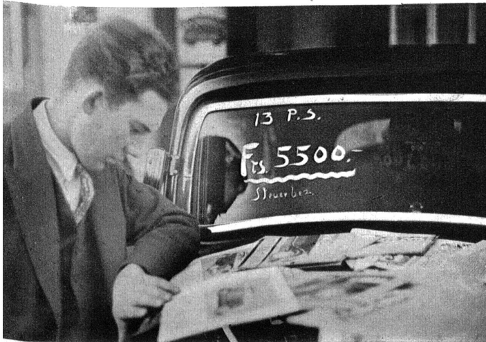
Viele neue Wagen stehn in Reih und Glied. Auf den Kühlerhauben liegen eine Menge Prospekte, die alle Vorteile des Wagens rühmen. Unverbindlich kann man alles studieren.