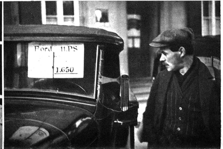
Bequemer als mein Handwagen wäre dieser alte Ford schon, um auf den Markt zu fahren. Er überlegt schon, wie er ihn in einen kleinen Lastwagen verwandeln könnte.