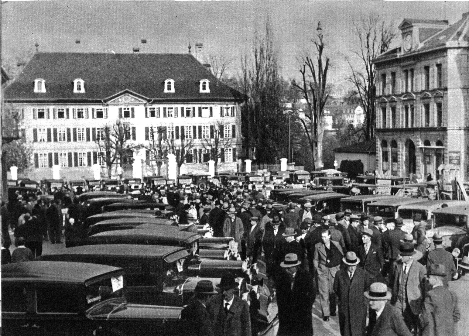
Jeden Dienstag mittag, nach Beendigung des Schweinemarktes, beginnt auf dem Waisenhausplatz in Bern der Automarkt.