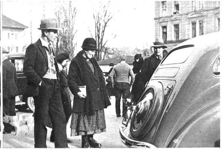
Grossmutter und Enkel. Die Grossmutter: „Bi dene tausigs moderne Auto weiss me bald nümme was vor- und hingernachen isch“.