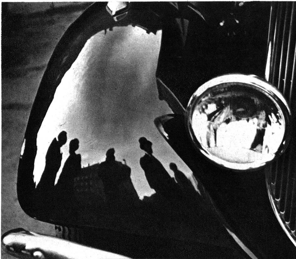
Wie viele Hoffnungen und Wünsche spiegeln sich in den wundervollen grossen Schutzblechen dieses Chryslers.