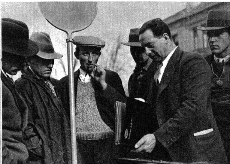
Der Herr Vertreter will schöne Bilder zeigen, man ist noch etwas misstrauisch, das wird sich aber bald legen.