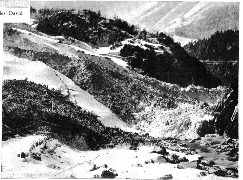
Verheerungen einer Grundlawine bei Amsteg.