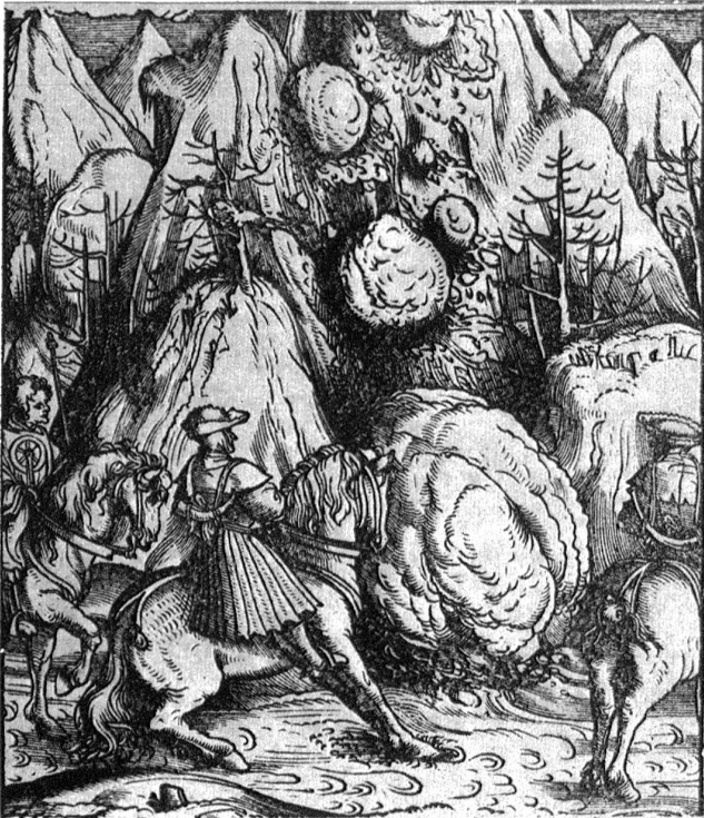
Holzchnitt aus dem Jahre 1537, aus dem Buch von den „Geferlicheiten und geschichten des löblichen streitbaren unnd hochberiempten Helden und Ritters Teütdank“, eines damals viel gelesenen Versromans.