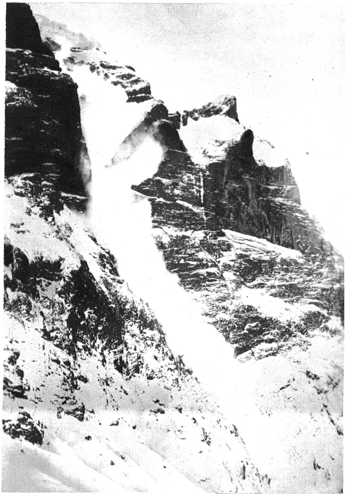
So sieht eine Staublawine in Wirklichkeit aus. (Staublawine am Wetterhorn.)