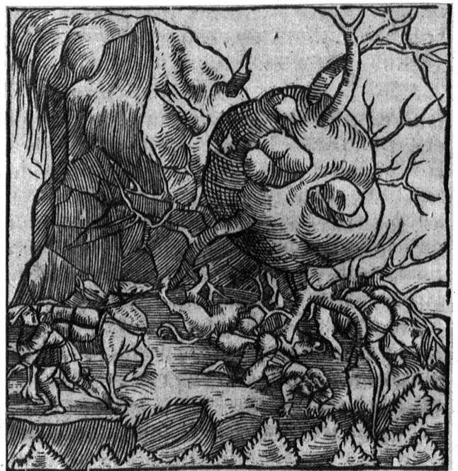
Holzchnitt aus der „Schweizerchronik“ von Stumpf 1548.