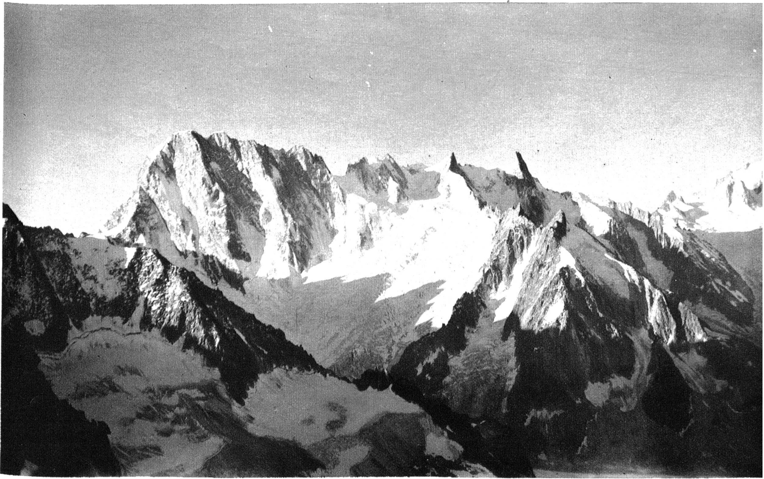
Die Grandes Jorasses (Nordwand), Dôme und Aig. de Rochefort und Aig. du Géant.