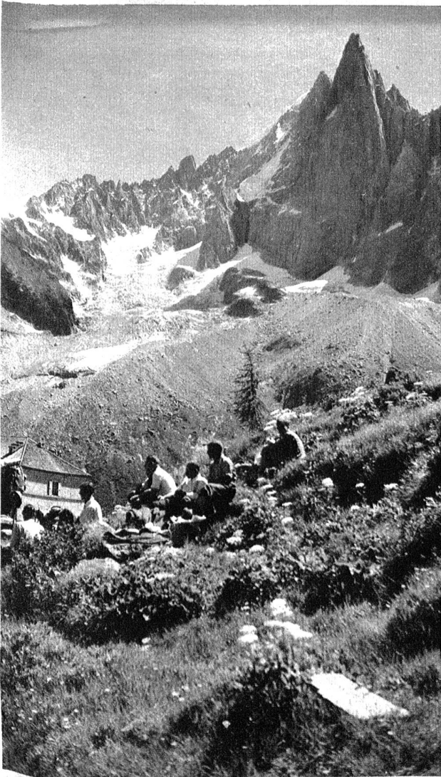
Rechts: Das alte Refuge du Couvercle mit dem Granitblock, unter dem in früheren Zeiten biwakiert wurde. Im Hintergrund die Droites.