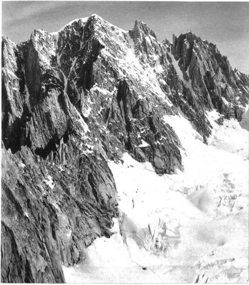
Links: Die Aiguille Verte, ein König der Berge.