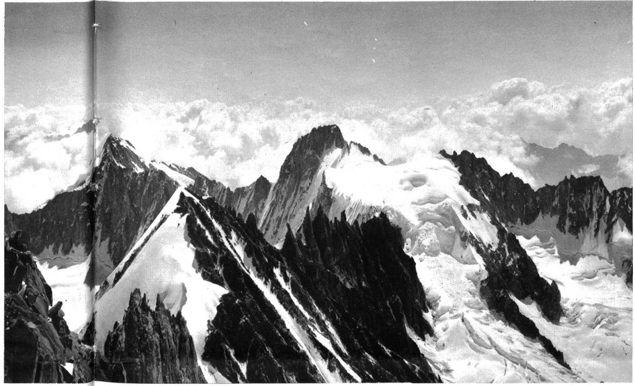
Blick von den Drottes nach Osten, auf Mont Dolent u. Aiguille de Triquet. Im Vordergrund die Courtes.