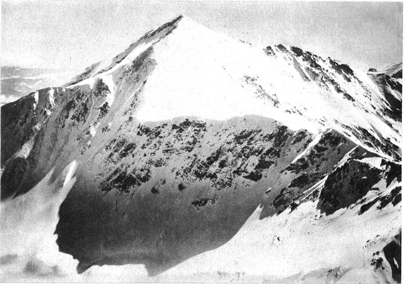
Hier finden die Skiweltmeisterschaften statt. Ein Blick in die Tatra in der Nähe von Zakopane in Polen, wo vom 11. bis 19. Februar die Ski-Weltmeisterschaften der FIS stattfinden.