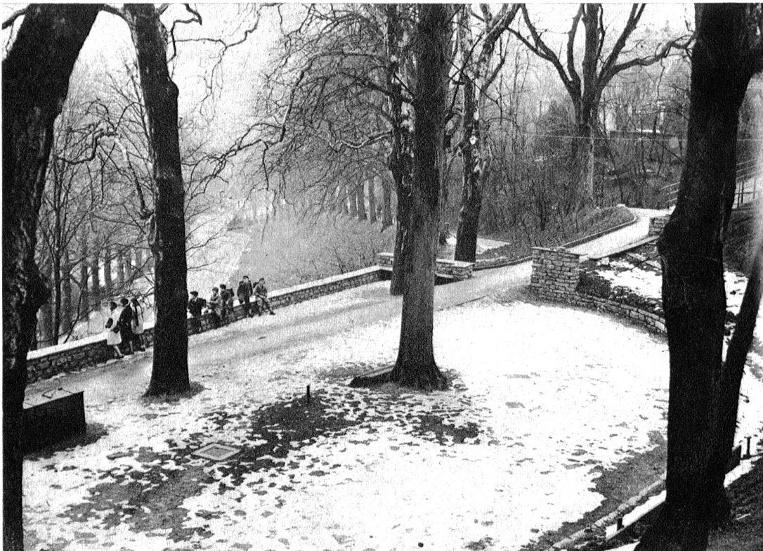
Zu Ehren des grossen Berner Dichters Rudolf von Tavel wird gegenwärtig ein Denkmal in der Form einer grossen Terrasse an der Liebegg erstellt. Von ihr schweift der Blick über die von der Aare umschlungene Altstadt mit dem beherrschenden Münster. Als Schmuck wird die Erstellung eines alten Brunnens aus einem bernischen Herrschaftssitz in Erwägung gezogen. Anstelle der sonst üblichen Denkmäler entsteht so eine sinnvolle Erinnerungsstätte an den grossen Berner Patrioten.