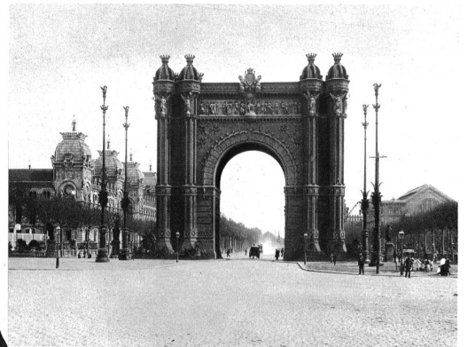
Barcelona ist als Hauptstadt des nationalistischen Spaniens ausgerufen worden. Wir zeigen aus Barcelona den Triumphbogen, der den Abschluss der breiten Strasse Salon de San Juan bildet.