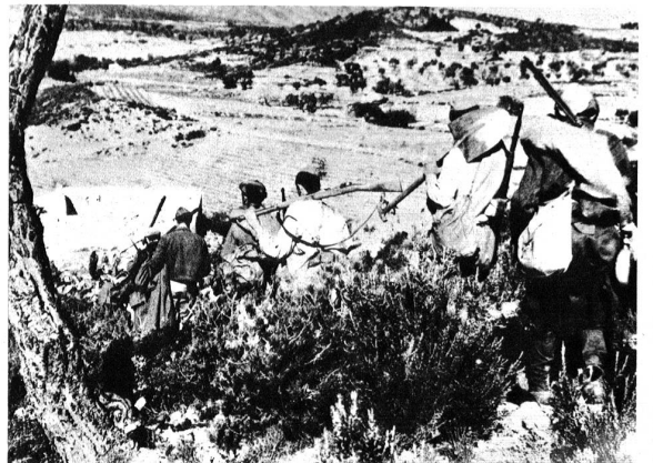
Ein nationalistisches Infanterie-Detachement auf seinem Vormarsch in Katalonien.