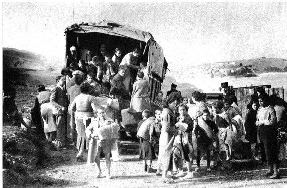
Eine Gruppe spanischer Flüchtlinge an der französischen Grenze. Wir machen unsere Leser in diesem Zusammenhang auf die klassische Flüchtlings-Dichtung, auf Goethes „Hermann und Dorothea“ aufmerksam.