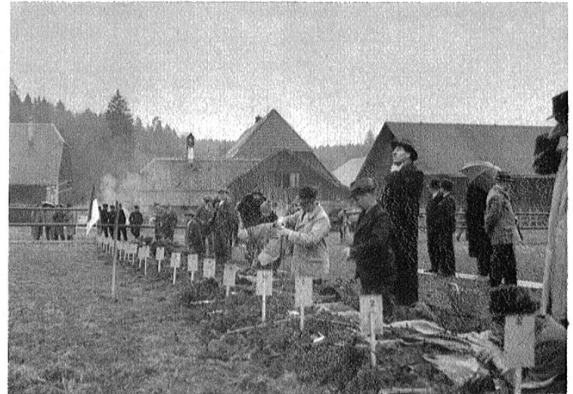
Bereitmachen vor dem Feuer.