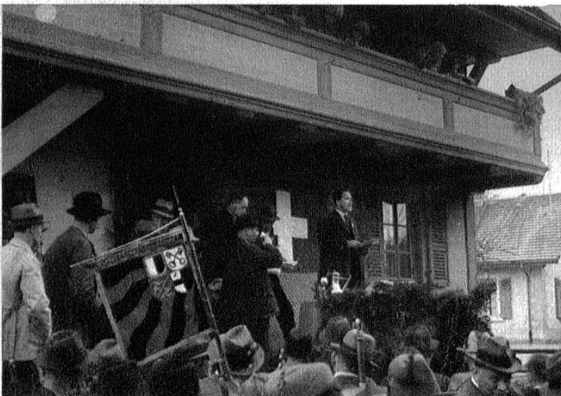
Der Verbandsschützenmeister verkündet die Ränge.