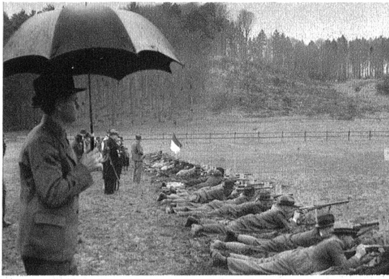
Die Schützenlinie. Geschossen wurde auf ein Feldziel, 12 Schüsse in 3 Minuten.