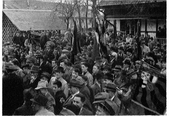
Gespannte Gesichter während der Rangverkündung.