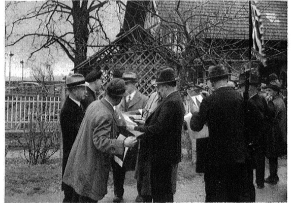
Die Scheiben sind offenbar nicht ganz nach Wunsch der Schützen.