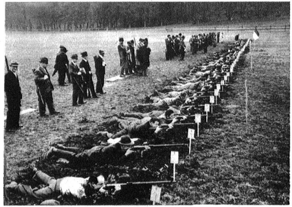
Die Schützenlinie im Feuer. Die Ablösung steht bereit.