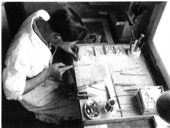
Rund 10,000 Häuschen sind bis heute mit Feile und Stichel in Spezialgips naturgetreu zugeschnitten worden.