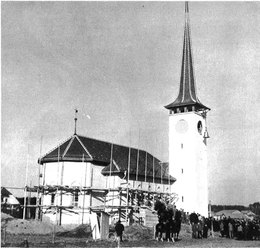
Der schmucke Neubau der Kirche von Zollikofen, der seiner baldigen Vollendung entgegengeht. Architekt: A. Wyttenbach.