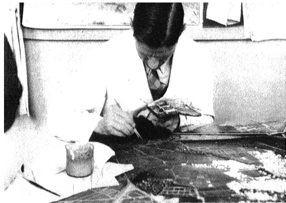
Ein „Landschafter“ besorgt die umfassende Terrainbemalung sowie die Bemalung jedes einzelnen Häuschens.