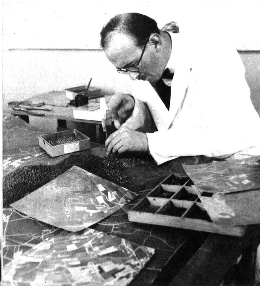
Zur Bewältigung dieser Arbeit brauchte es einen Zeitaufwand von rund 25,000 Arbeitsstunden. Tausende von einzelnen Bäumchen sind zur Darstellung von Laub und Nadelwäldern verwendet worden.