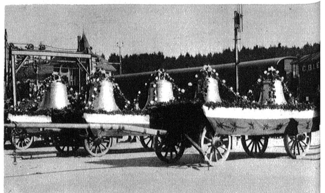
Von der Schuljugend festlich geschmückt, harren die von einigen hochherzigen Gönnern der Gemeinde Zollikofen gestifteten Glocken ihres Abtransportes auf den Kirchplatz.