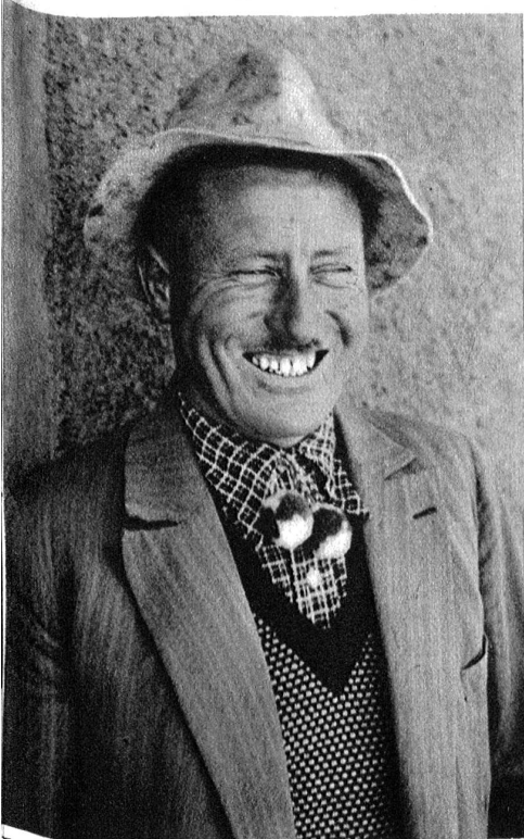
Einer von denen, die sich über unsern Aprilscherz und die Hereingefallenen ergötzen.

Wir bitten alle diejenigen, welche sich letzten Samstag zwischen 2 und 5 Uhr mit Ueberkleidern und genagelten Schuhen auf den Spiegel hinauf bemüht haben, um Entschuldigung; wir können ihnen zu ihrer Beruhigung versichern, daß wir auf eindringlichen Wunsch der Beteiligten davon absehen wollen, ihre zum Teil verdugten, zum Teil recht erzürnten Gesichter, die unser Photograph aufgenommen hat, hier im Bilde zu veröffentlichen. Sollte hingegen wirklich einmal eine Höhle am Gurten entdeckt werden, dann werden wir nicht verfehlen, sie alle in erster Linie und vor allen übrigen Leuten wieder zum Besuche einzuladen.