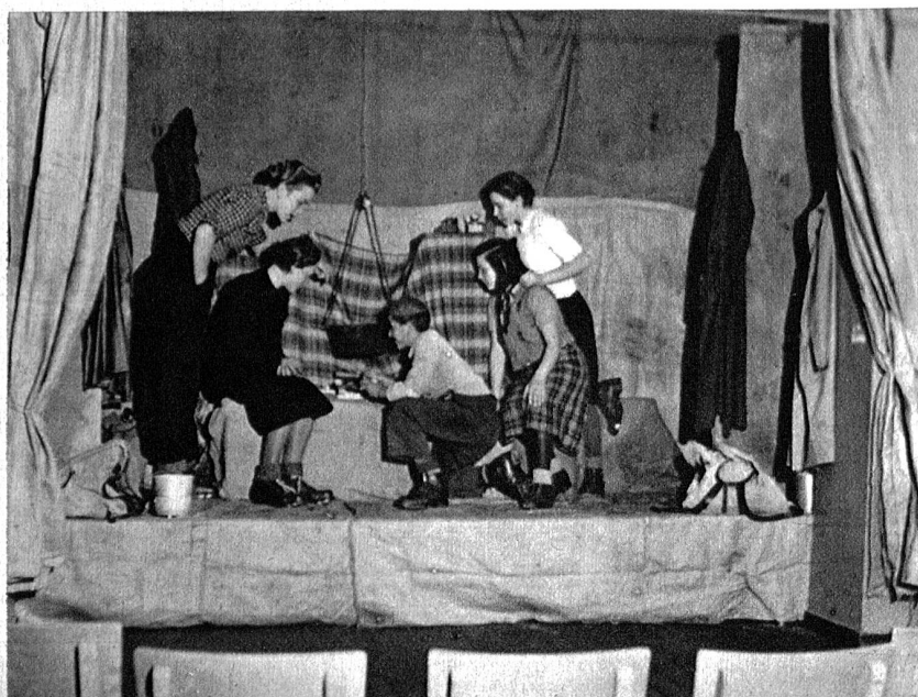
„I bruuche numen eis.“

Bier Mädchen aus der Stadt kommen bei strömendem Regen ganz durchnässt in eine Semnhütte. Soeben ist sie von den beiden Kindern des Besitzers, vom 8jährigen Köbi und dem 10jährigen Züseli, trotz des Wetters, verlassen worden. Die beiden gehen in die untere Hütte zurück. Die Stadtmädchen finden in der offenen Hütte eine Unterkunft. Sie möchten sich gerne wärmen und etwas Tee kochen. Zu ihrem Schrecken ist der Trockenspiritus „Meta“ naß geworden. Wie nun Feuer machen? Holz ist genügend da, aber keines der Mädchen hat jemals mit Holz gefeuert. Ihre unpraktischen Versuche scheitern an ihrer kläglichen Unkenntnis. Zu Hause haben sie Gas oder Elektrizität zum Kochen. Was nun? Sie wissen zwar ganz genau, was 1792 passiert ist — aber Feuer machen . . . Zu ihrem Glück erscheint Köbi wieder, der zurückgekommen ist, um eine vergessene Petrolpinte zu holen. Wer weiß, die Mädchen hätten am Ende noch versucht mit Petrol anzufeuern. Der erstaunte Köbi zeigt nun den großen Meitschi, wie man ein Holzfeuer anzündet.