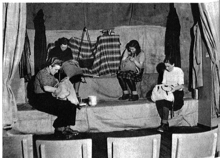
„Gottseidank, ändtliche nes schützens Dach über üsne Chöpfe.“