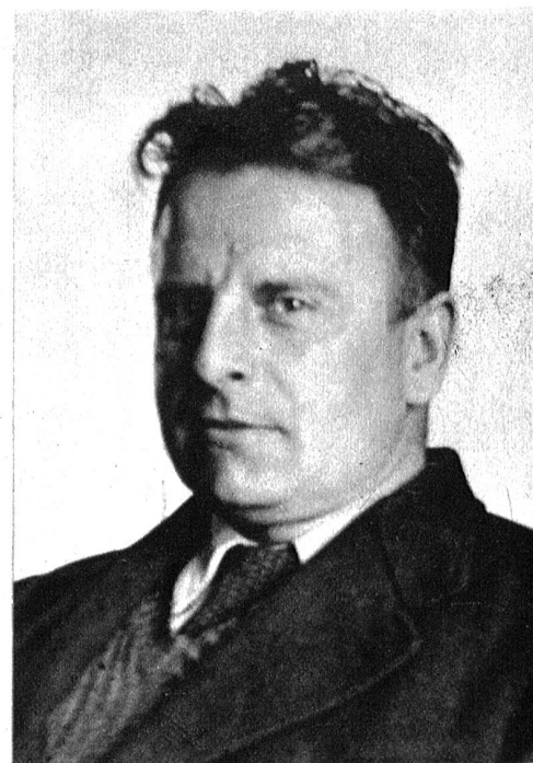
Der Autor: Hans Zulliger, Ittigen