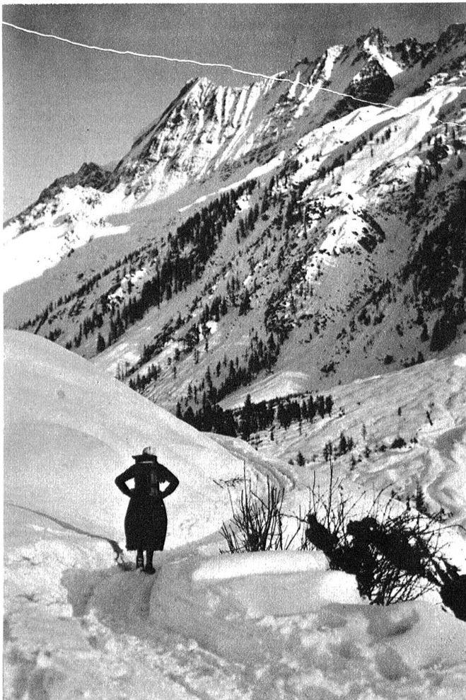
Lötschen. Am Weg nach Kühmatt.