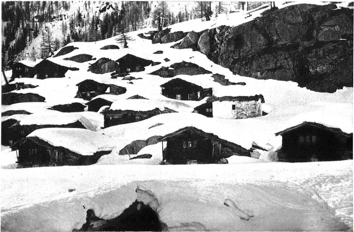
Gletscheralp im Lötschental. Die Ställe und Häuser sind mit den Felsen wie verwachsen.