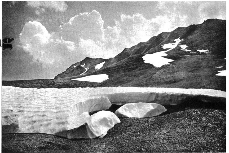
Adelboden, Schneeschmelze im Schalmi am Hahnenmoospass. Die wellige Oberfläche des Schnees zeigt die typischen Spuren der Föhnwindwirkung.