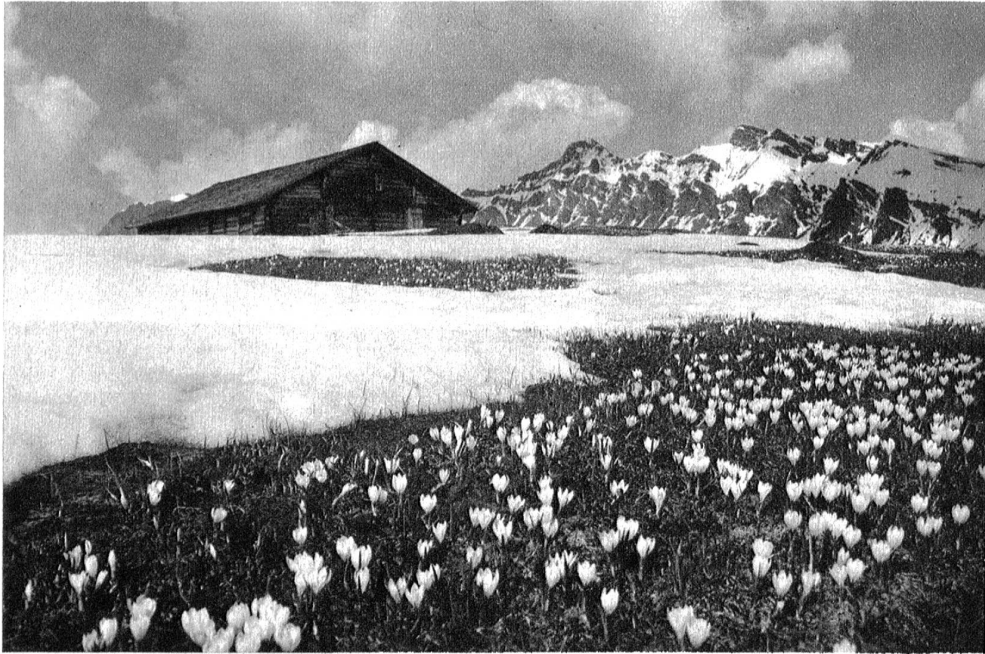
Föhnstimmung auf der Winteregg bei Müren.