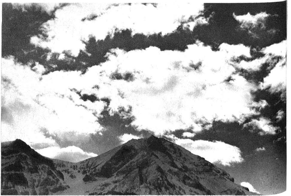
Föhnstimmung über Adelboden.