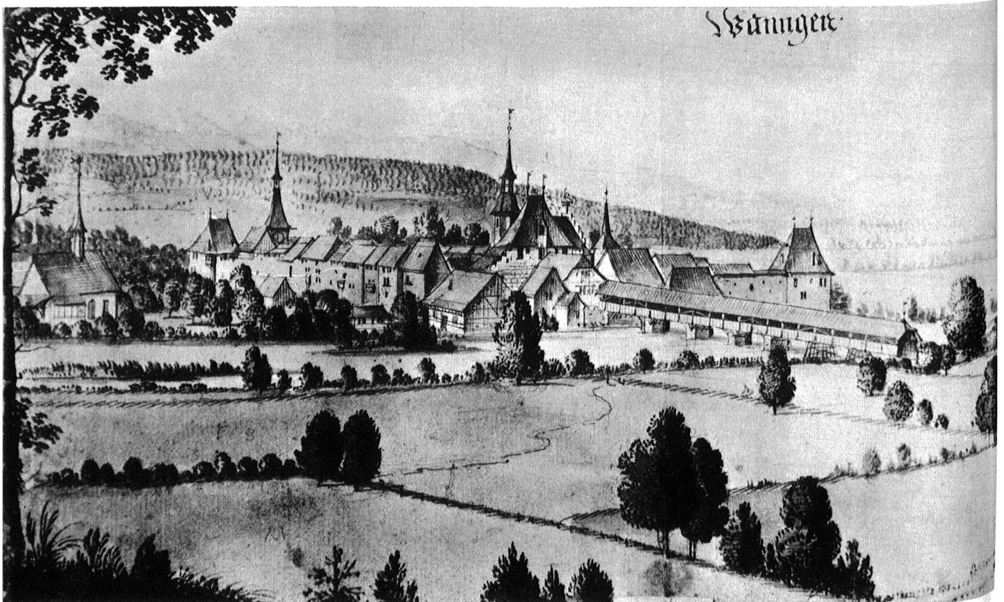
Wangen um 1670. Ansicht des Städtchens mit der Aarebrücke, gemalt von Albrecht Kauw († 1682).