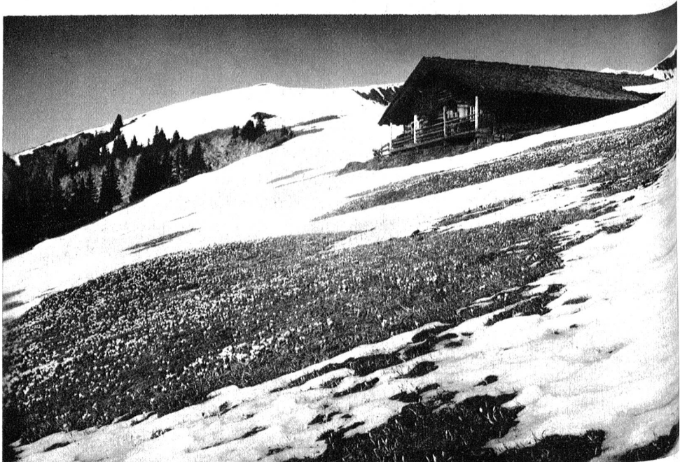
Adelboden, Schwandfelspitz.