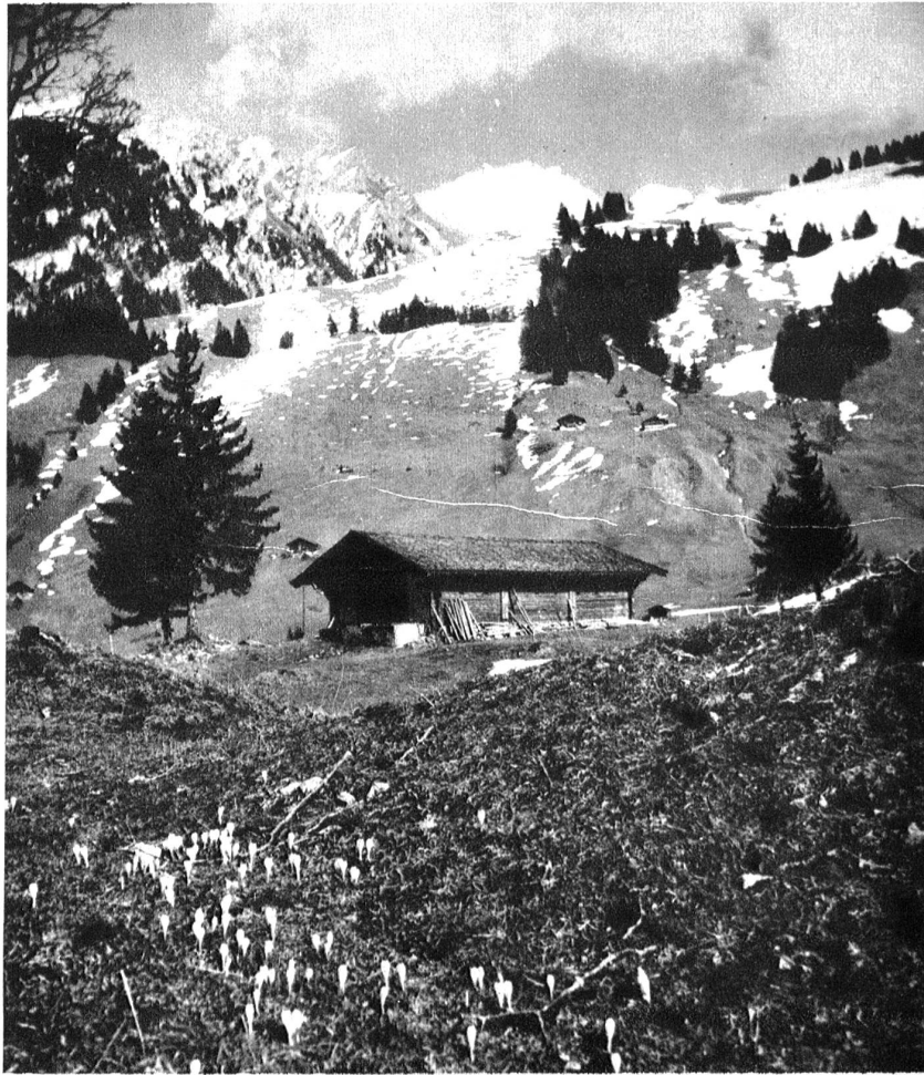
Frühling auf der Grimmialp. Diemtigtal.