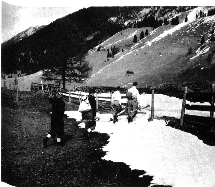
Grimmialp: Nach der Abfahrt vom Rauflihorn.