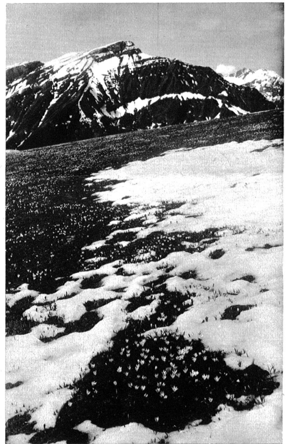
Bergfrühling auf Giesenenalp (Kandertal).