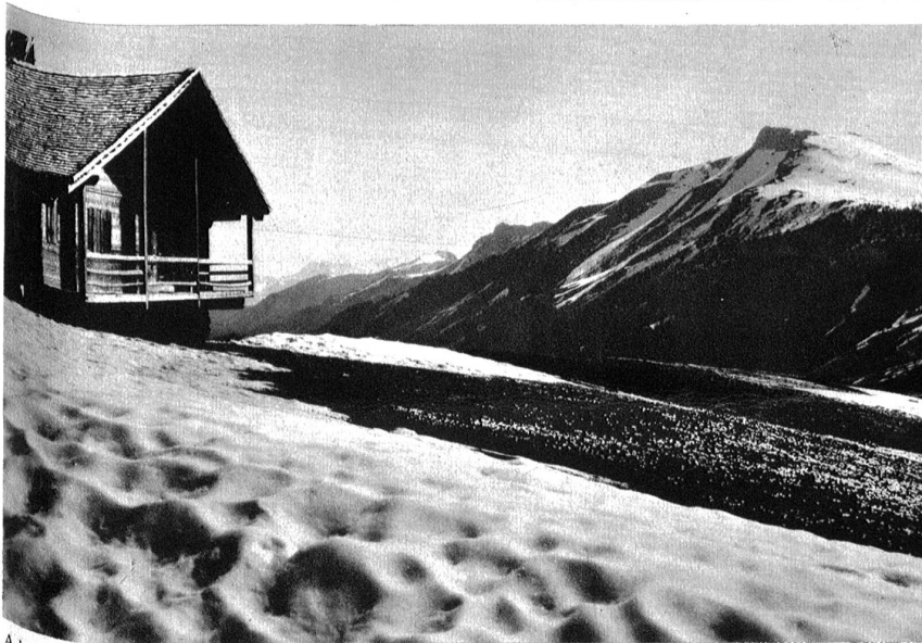
Adelboden: Tschentenalp im Frühling, Elsighorn.