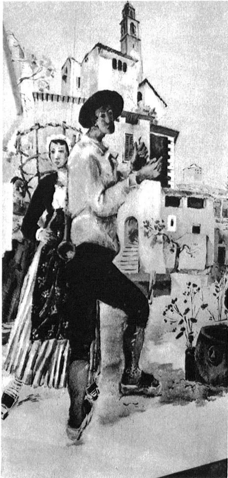
Wandmalerei im Grotto Ticinese