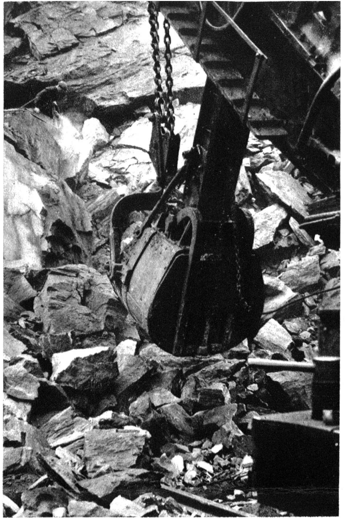
Der starke Greifer an der Arbeit. Müheelos hebt er die eisenschweren Gesteinsbrocken in die Kippwagen. Mit seinen eisernen Fingern greift er in Ritzen und Spalten und vollendet der Sprengung wuchtiges Werk.