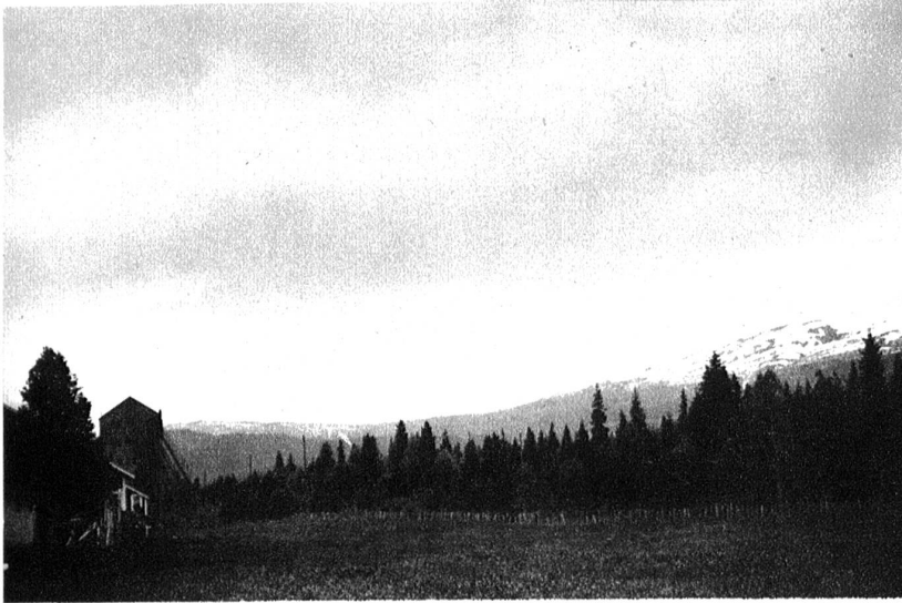
Blick über das Grubengebiet im Dunderlandstal. Links die hohe Gesteinsmühle mit der steilen Auffahrt für die Kippwagen.