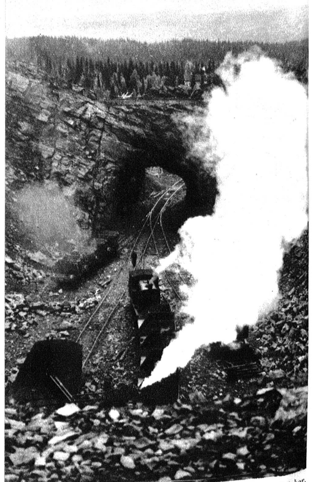
So bauen die Menschen am Berg, graben tiefe Löcher, sprengen ein Stück nach dem andern weg, bis eines Tages der ganze Berg abgetragen sein wird, denn seine Felsen bergen das in unsern Tagen so kostbare Eisenerz.

Hier einige Bilder aus den Erzgruben im Dunderlandstal ob dem Städtchen Mo am Ransfjord. Wie fast bei allen Gruben Nord-Norwegens wird hier das wertvolle Eisenerz noch im Tagabbau gewonnen. Ein ganzer Berg besteht aus reichlich erzhaltigem Gestein und wird Stück für Stück abgetragen. Die großen Gesteinsbrocken werden in einer Gesteinsmühle zwischen riesigen Walzen zu Erzsand zermalmt und mit einer kleinen Grubenbahn an das Fjord spediert und dort direkt auf die schwarzen Erzschiffe verladen. Vom norwegischen Fjord dampfen die Schiffe direkt nach den verschiedenen Abnehmerstaaten, von denen Deutschland an erster Stelle steht.