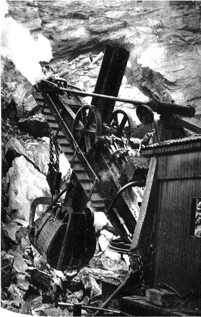
Mit grossen und starken Greifern werden die abgesprengten Gesteinsbrocken gefasst und in die bereitstehenden Kippwagen gehoben.