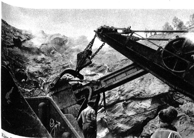
Eine Wolke von feinem Eisenstaub liegt über den Gruben und setzt sich grauglänzend auf Gesicht, Hände und Kleider, dringt ein in die Atmungsorgane und zerstört langsam und sicher die zähen und tüchtigen nord-norwegischen Arbeiter.

Die Rollwagen mit den grossen Gesteinsbrocken werden über eine steile Auffahrt in die Höhe dieses hohen Hauses gezogen und gekippt. In einer Reihe von Walzen werden die groben Steinbrocken zermalmt und kommen unten als feiner Erzsand aus der Gesteinsmühle.