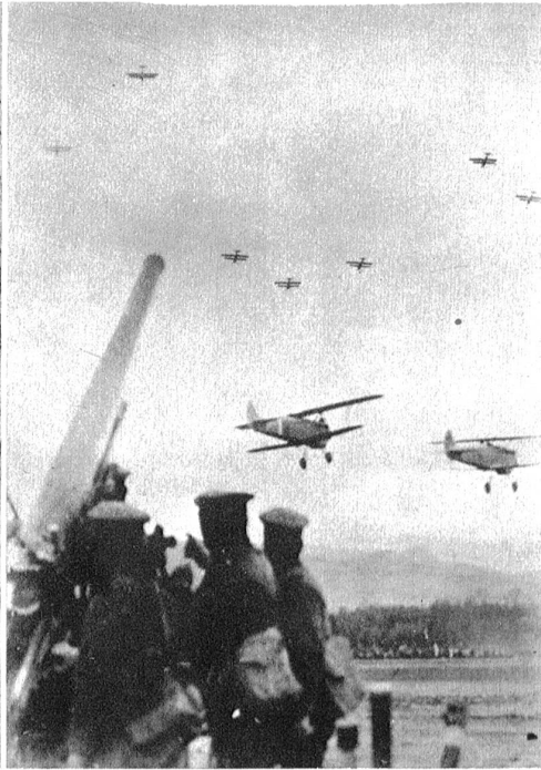
Japanische Flieger und japanische Artillerie an der südchinesischen Kampffront.