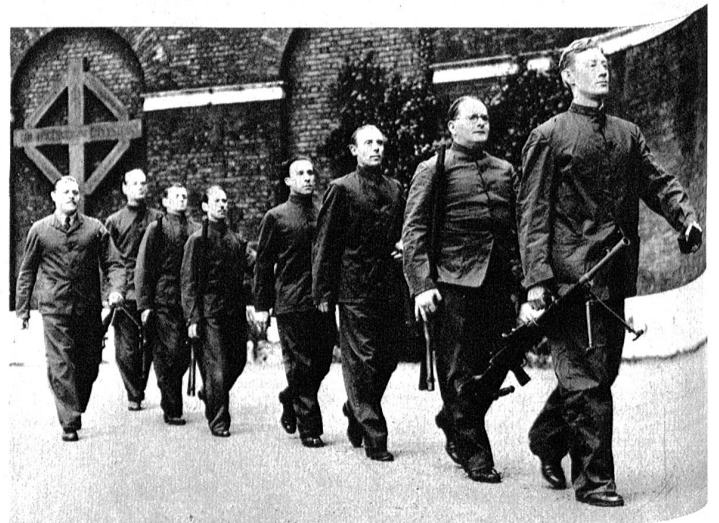
Auch die Bühne macht sich kriegsbereit. Englische Schauspieler beim Morgenexerzieren. (Phot. Keystone).