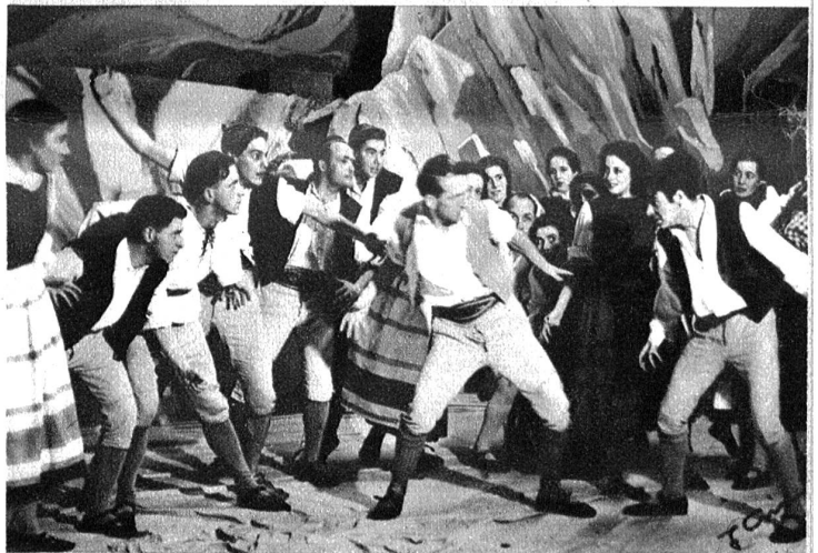
Aus der Tanzpantomime „Das Dorf unter dem Gletscher“ von Heinrich Sutermeister und Albert Rösler.