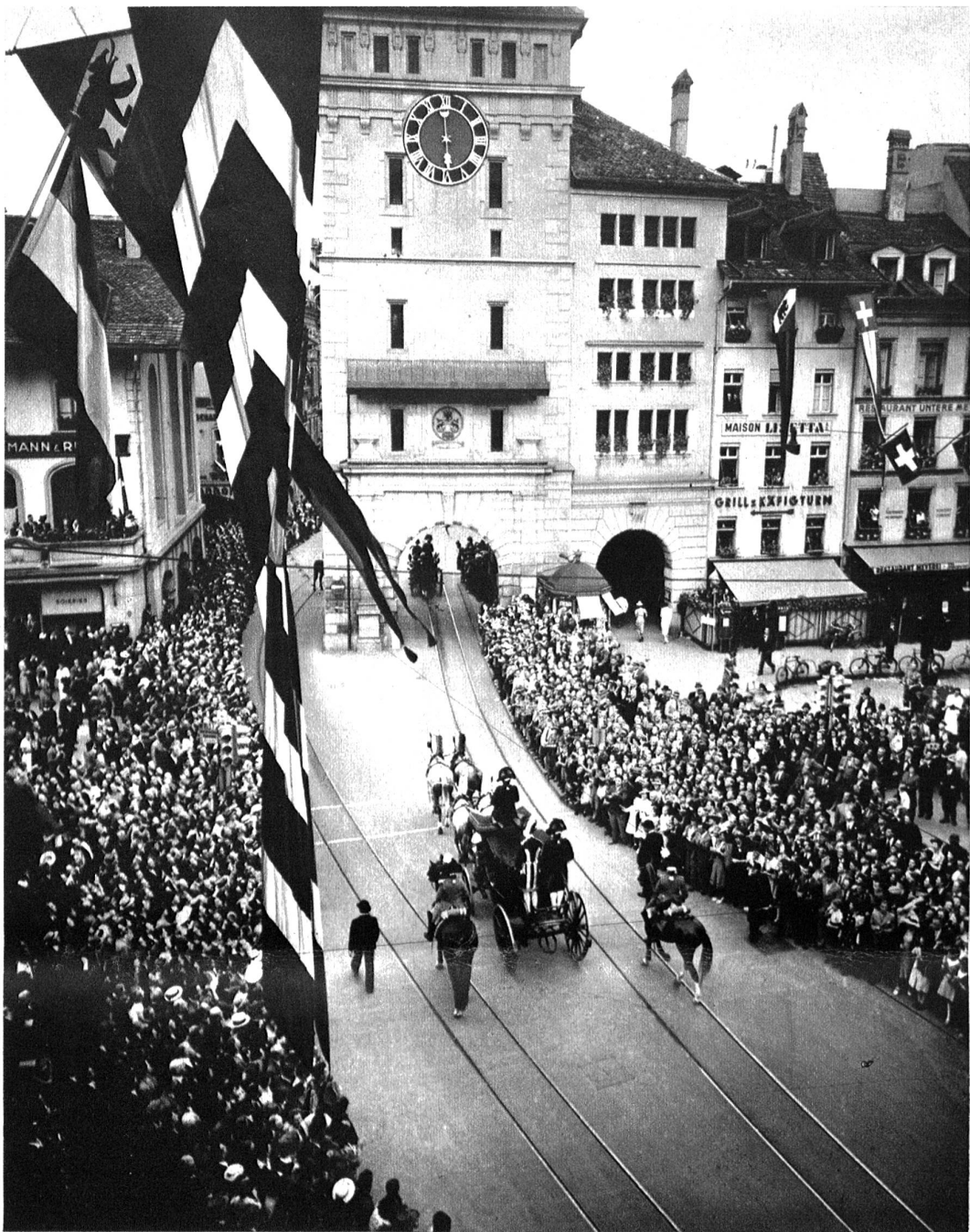
Die vierspännige Ehrenkutsche des Lord Mayors beim Käfigturm.