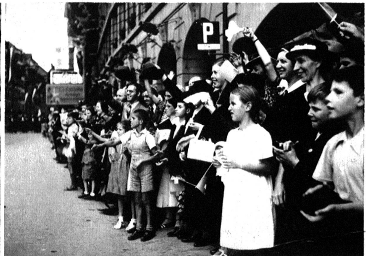
Die begeisterten Zuschauer