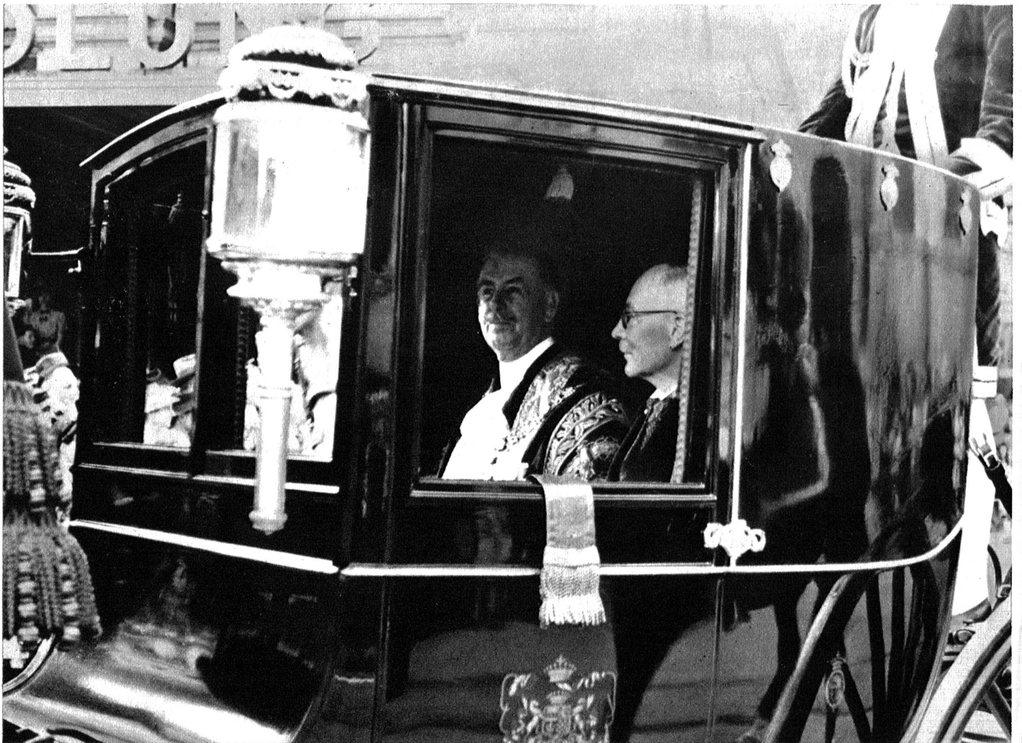
Der Lord Mayor von London, Sir Frank Bowater, mit Regierungspräsident Dr. Dürrenmatt in der vom Historischen Museum Bern zur Verfügung gestellten Paradekutsche.