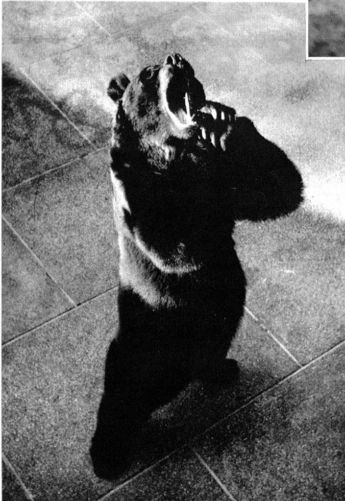
— aber den Bären ist es gleichgültig, von wem die Rübli kommen, — ob es königlich grossbritannische oder gemeinderätliche sind, sie fressen sie immer mit derselben Behaglichkeit.