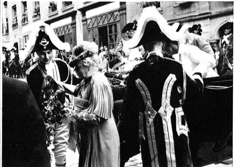
Lady Mayoress beim Verlassen ihres Wagens zum Besuch des Wattenwylhauses an der Junkerngasse. Die englischen Diener in ihren prächtigen Paraderöcken sind beim Aussteigen behilflich. Die ganze Gasse ist durch die Ehrengarde in den historischen Uniformen der 1798er Berner Dragoner abgesperrt.