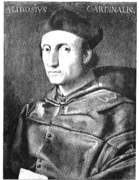
Bildnis des Kardinals Francesco Alidosi, aus dem Museum Jorianum, das ebenfalls gewisse Verwandtschaft mit dem Raffaelschen Portrait zeigt.