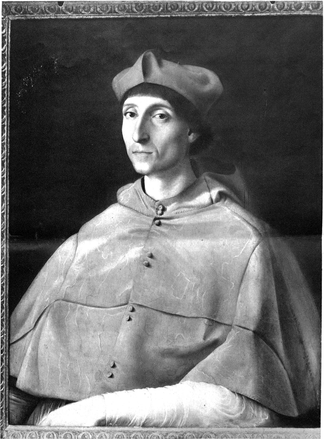
Das Portrait des unbekanntes Kardinals von Raffael