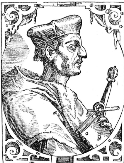
Porträt Schiners, Holzschnitt von Tobias Stimmer, Basel 1575, nach obenstehendem Bild im Museum Jorianum.

Ist es der berühmte Schweizer Kardinal Matthäus Schiner (1465—1522), der Kardinal der Mailänderzüge, der päpstliche Legat im Jeterprozess in Bern (1508), der selbst 1521 beinahe zum Papst gewählt worden wäre? Schiner ist eine der interessantesten Renaissancegestalten, eine der grössten Persönlichkeiten überhaupt, welche die Schweiz aufweist, Walliser von Geburt, Bischof von Sitten, Bischof von Novara, Kardinal und päpstlicher Legat, Stellvertreter des Kaisers in Italien, intimster Ratgeber Kaiser Karls V., und politischer Gegenspieler Luthers: Kirchenfürst, Politiker, Gelehrter und Asket, ein Mann von überragender historischer Bedeutung. Er trieb die Schweizer in die Mailänderzüge im Dienste des Papstes gegen Frankreich, die mit der Niederlage von Marignano endeten; und die Schweiz verdankt ihm die heutige Zugehörigkeit von Bellinzona und Blenio zur Eidgenossenschaft.