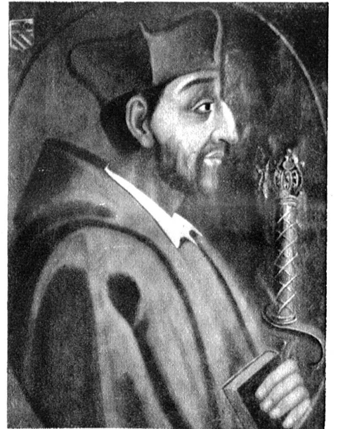
Porträt Schiners im Kapuzinerkloster zu Sitten (17./18. Jahrhundert).