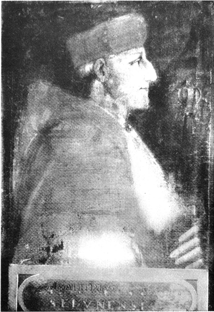
Bildnis des Kardinals Matthäus Schiner aus dem Museum Jorianum (um 1520), das nach Ansicht der Gelehrten dem Raffaelschen Portrait des unbekanntes Kardinals am nächsten steht.