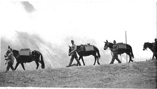
Schwieriger Lebensmitteltransport mit Saustieren im Wallis.