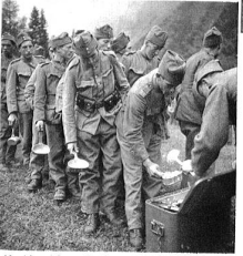
Hochbetrieb auf dem Fassungsplatz.