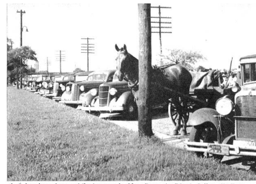
Auf hundert Automobile kommt in New Bern ein Pferd. Selbst die Frauen fahren mit ihren Wagen zum Markte. Ein „Car“ gehört in Amerika zum Menschen, er ist sein Schuhzeug.

Das Leben, der Wohlstand und die guten Sitten eines Staates, einer Stadt oder einer Gemeinde spiegeln sich nirgends besser wieder, als auf einem einfachen Wochenmarkte. Da vereinigt sich Stadt und Land, da nähert sich der Mensch dem Menschen — das Gemüse bringt sie zusammen. Der Markt von New Bern befindet sich nicht an einer heimeligen Kehler- oder Bundesgasse. Ein „Jibelemarkt“, ein „Meißchmarkt“ mit Tang im Stern oder Kornbausteller kennen diese Berner natürlich nicht. Der gewöhnliche Wochenmarkt befindet sich außerhalb der Stadt, an einer wenig befahrenen Zufahrtstraße, dem Trottoir entlang auf grüner Wiese. Die Berner kommen mit ihrem „Neu-Bärnerwägel“, — es sind meistens alte Fordwagen, vollgeprokelt mit Gemüse und Geflügel — zur Stadt gefahren. Nicht selten fährt die ganze Familie mit. Das Gesamtbild dieses Marktes erinnert an eines der farbenreichen Silber von Franz Buchser. Regenerinnen in hellgelben, grünen oder roten, dünnen Kleidern, dazwischen hellblonde Bernerinnen in weißen Blusen, Bauern in blassen Leberkleibern sind da. Unter der tropischen Sonne dauert der Markttrieb bis 11 Uhr mittags, ein „Schiffenmarkt“ wie bei uns kennt New Bern noch nicht.