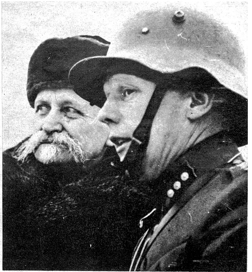
Der Präsident der Republik Finnland, Kallio, mit einem finnischen Offizier.