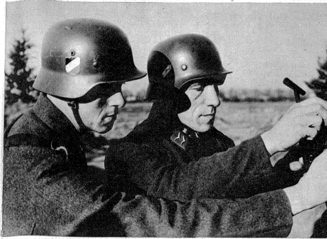
Richten und Einstellen der 8,8 cm-Flugabwehrkanone.