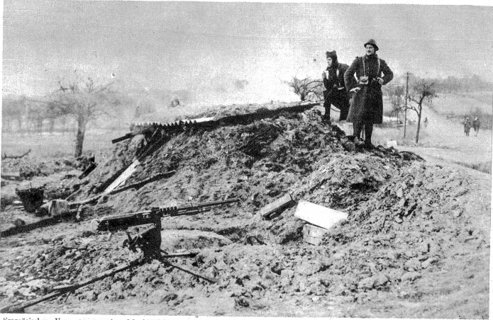
Französischer Vorposten an der Maginot-Linie