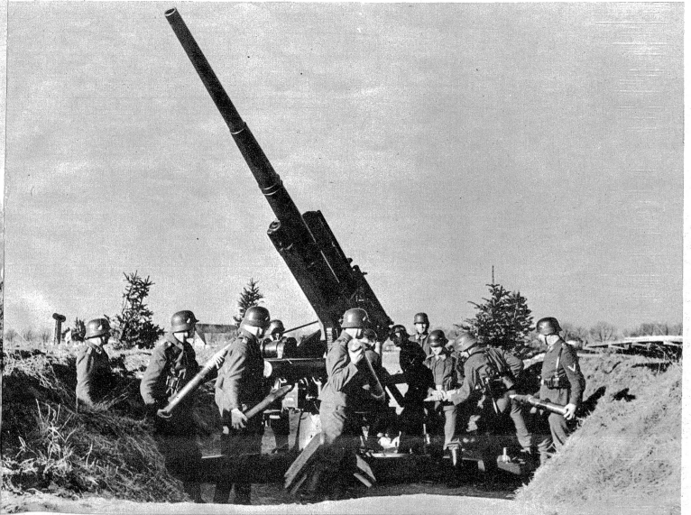
Deutsches 8,8 cm-Flugabwehrgeschütz in Feuerbereitschaft.