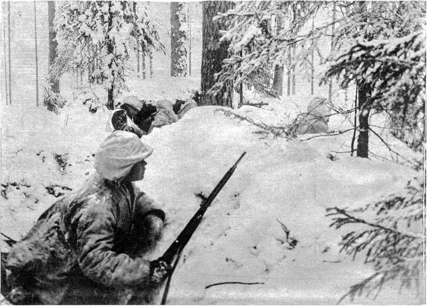
Vorposten in der finnischen Verteidigungslinie.