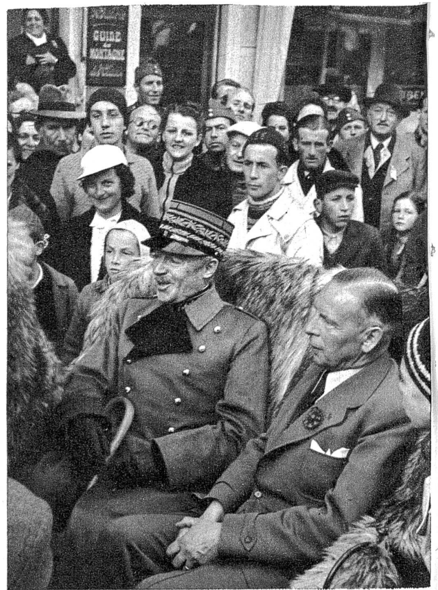
General Guisan, Ehrenpräsident des Schweiz. Skirennens, unter den Zuschauern.

Es ist ein besonders guter Gedanke, unsere Sportler und Sportbegeisterten auf eine solche Weise auf unser nationales Hilfswerk hinzuweisen und für die gute Sache vorzuspannen. Wenn irgendwo, dann darf gerade unter Sportlern restlose Bereitschaft und Solidarität für eine grosszügige Hilfeleistung an die vom Schicksal hart betroffenen Wehrmänner vorausgesetzt werden.