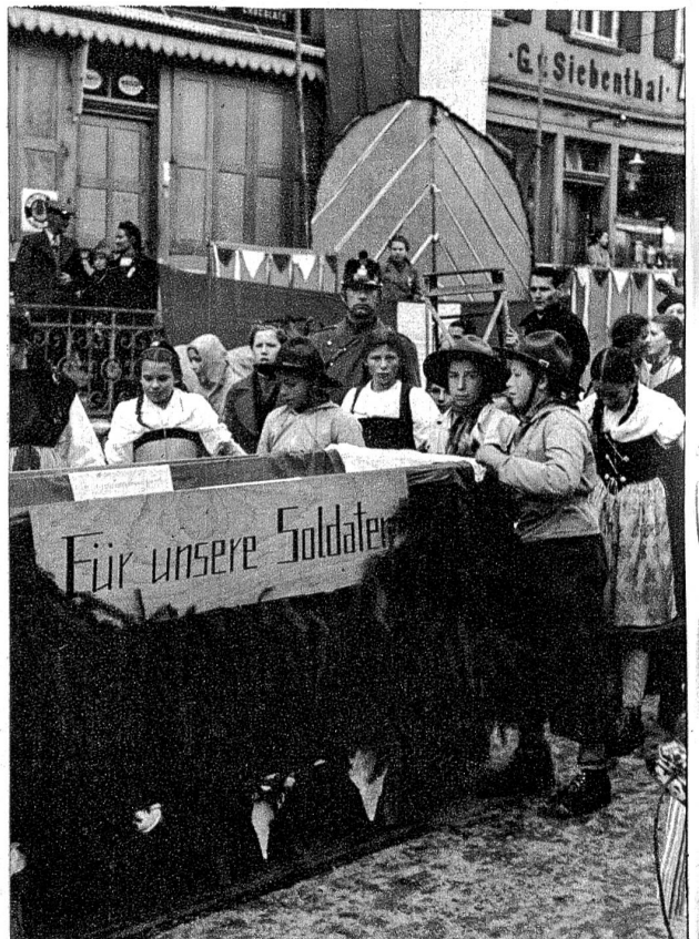
Der Sammelschlitten, der von der Gstaader Jugend herumgeführt wurde und einen sehr schönen Ertrag abwarf.

Es ist ein besonders guter Gedanke, unsere Sportler und Sportbegeisterten auf eine solche Weise auf unser nationales Hilfswerk hinzuweisen und für die gute Sache vorzuspannen. Wenn irgendwo, dann darf gerade unter Sportlern restlose Bereitschaft und Solidarität für eine grosszügige Hilfeleistung an die vom Schicksal hart betroffenen Wehrmänner vorausgesetzt werden.