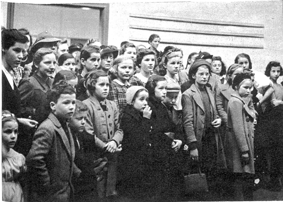
Aufmerksam und mit Spannung folgen Gross und Klein den Darbietungen der jungen Schauspielerinnen, die vom bösen Gessler und der Gründung des Eidgenossenbundes berichten.