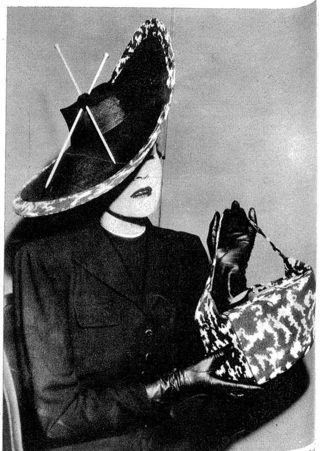
Der neueste Frühlingshut, ebenfalls aus New York: ein alter Hutrand, ein Knäuelchen Garn und zwei Stricknadeln und eine originelle Neuschöpfung ist fertig, nachdem man den Rand noch mit Tarnungsmuster (was auch wieder höchst modern gesehen hat).