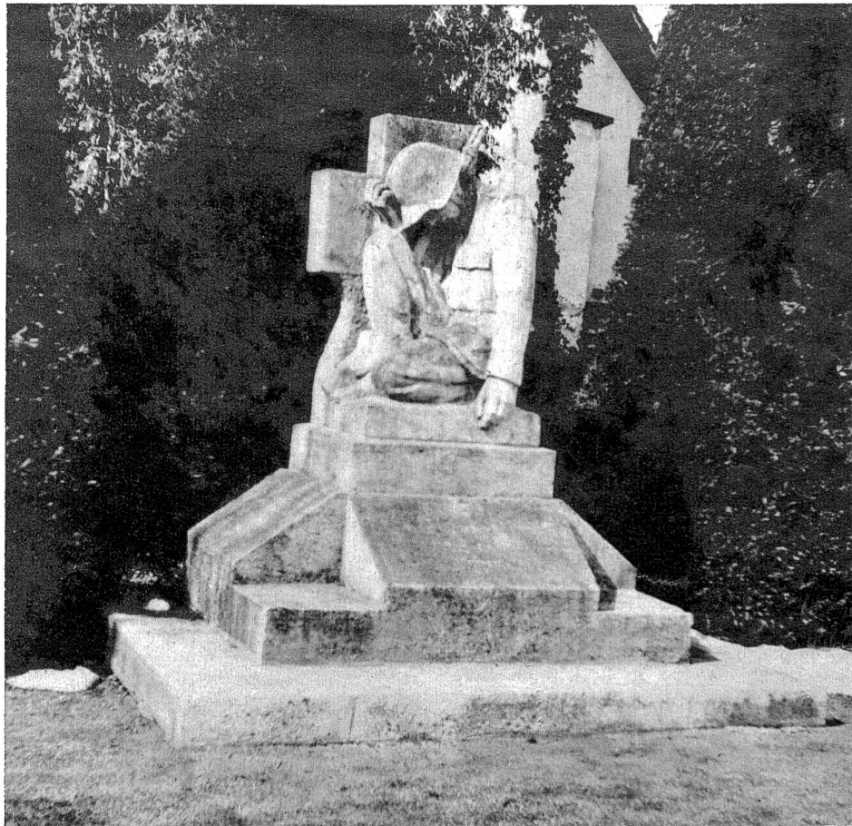
Hier vor dem Soldatendenkmal in Oberdießbach findet nach Schluss des Schiessens eine schlichte vaterländische Feier mit Kranzniederlegung statt. Es ist immer ein eindruckliches Bild, wenn sich unter Trommelwirbel die Fahnen senken; dann herrscht vollständige Stille.

Nachher begeben sich die Schützen zur Schützengemeinde in den Saal des Gasthof zum Löwen zur Entgegennahme der Resultate und verbringen daselbst bei allerlei fröhlichen Produktionen und humorvollen Darbietungen ein Stündchen in guter Kameradschaft. Jeder denkt und hofft den andern übers Jahr in guter Gesundheit wieder zu sehen.