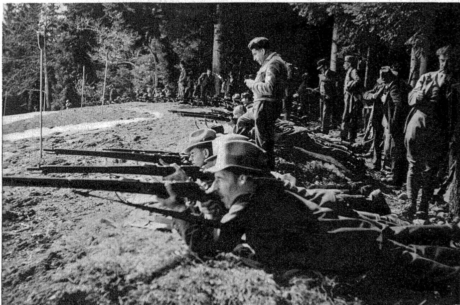
An einem geschützten Waldrand liegen die Schützen am Boden. Sie müssen über eine Mulde schießen, denn ihnen gegenüber in 300 m Entfernung stehen die B-Scheiben, 50 an der Zahl, aneinandergereiht. Es heisst genau aufpassen, dass nicht in die falsche Scheibe geschossen wird, sonst gibts natürlich einen Nuller. Das Schiessprogramm umfasst 18 Schüsse: Einzelschüsse 1, 2, 3; 6 Schüsse Serienfeuer in 2 Minuten, dann 6 Schüsse Schnellfeuer in 1 Minute. Geschossen wird auf Kommando. Nichtbefolgung des Befehls „Sichern“ zieht Wegweisung vom Schiessplatz und Wegnahme des Standblattes nach sich. Jeder Schütze muss seinem Nachfolger das Standblatt führen.