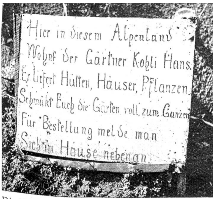
Die Visitenkarte des Urhebers