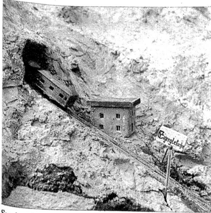
Station Eigergletscher der Jungfrauabahn.