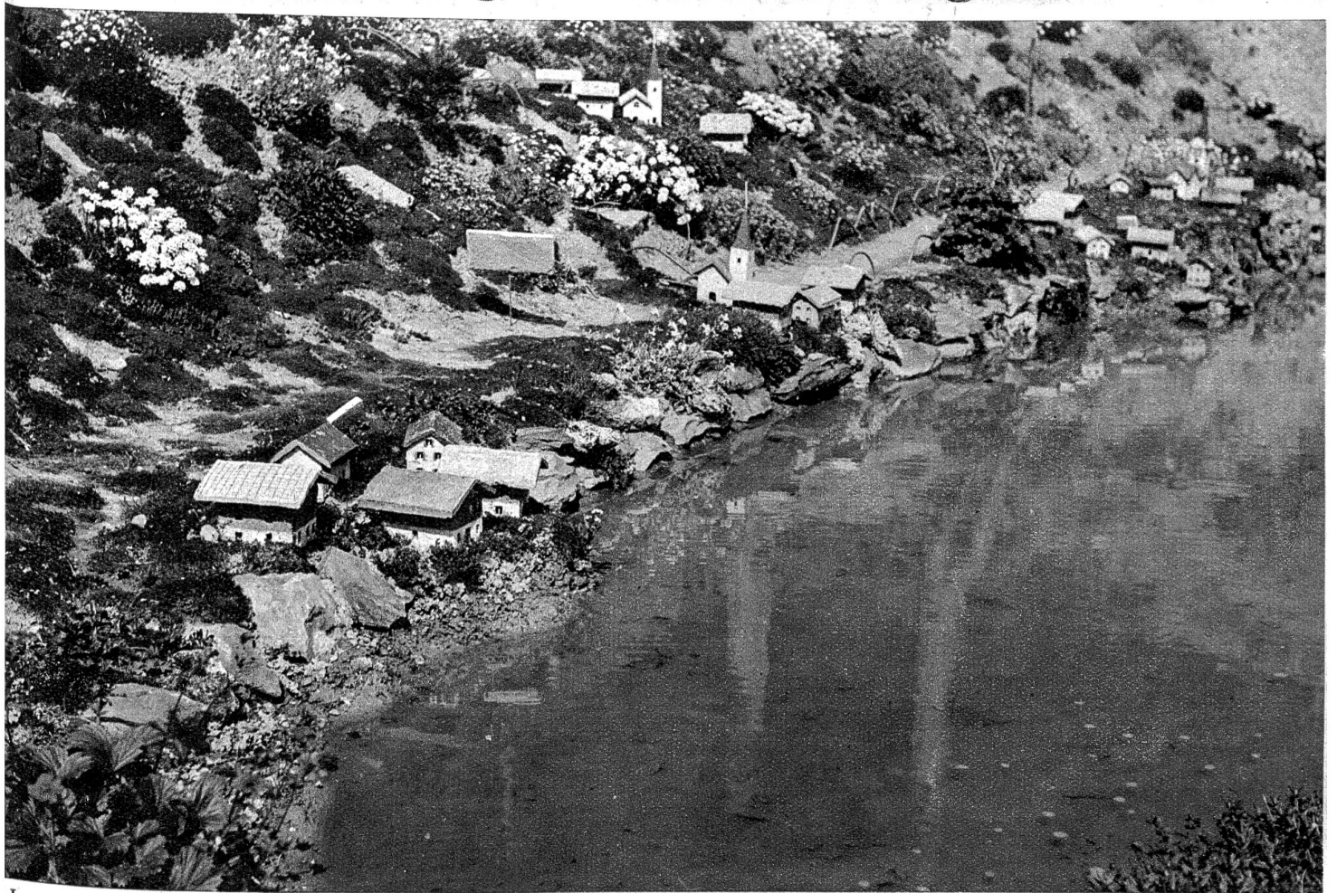
Landschaft am Thunersee.