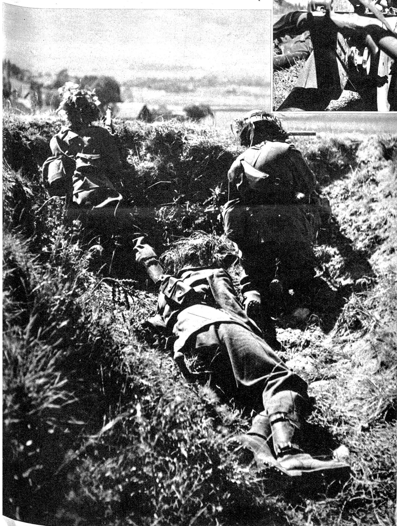
Das leichte Maschinen- gewehr des Radfahrer- zuges ist überraschend vorgestossen und in Deckung. Ungetarnte Helme glänzen in der Sonne und sind Km- weit sichtbar. Daher das Laubwerk um den Helm. Z.-Nr. N.T. 548.