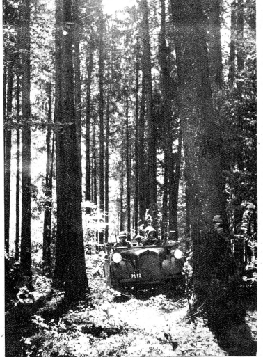
Die Motorradfahrer-Kundschafter. Z.-Nr. N.T. 563.