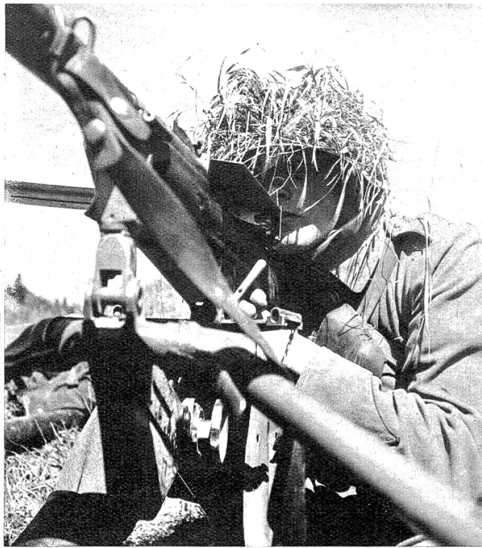
Das malerische Vogelnest auf dem Helm ist Tarnung. Zens. Nr. N.T. 549