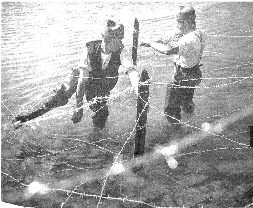
Territorialsoldaten errichten eine Sperre an einem Seeufer zur Verhinderung der Landung von Wasserflugzeugen.