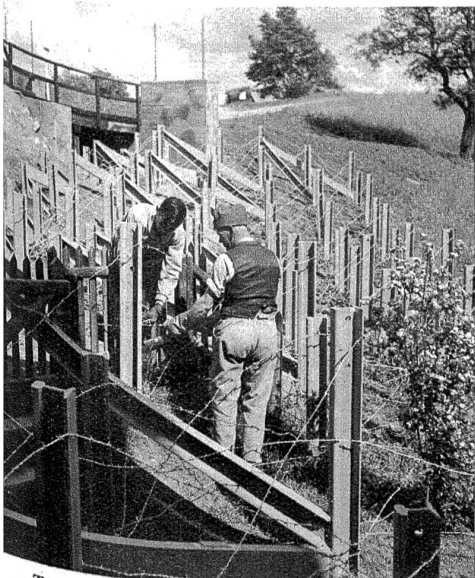
Tanksperrung aus Eisenbahnschienen in einem Villenviertel. III 1590 — He