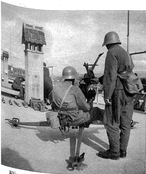
Fliegerabwehrgeschütz in Stellung auf einem Flachdach.