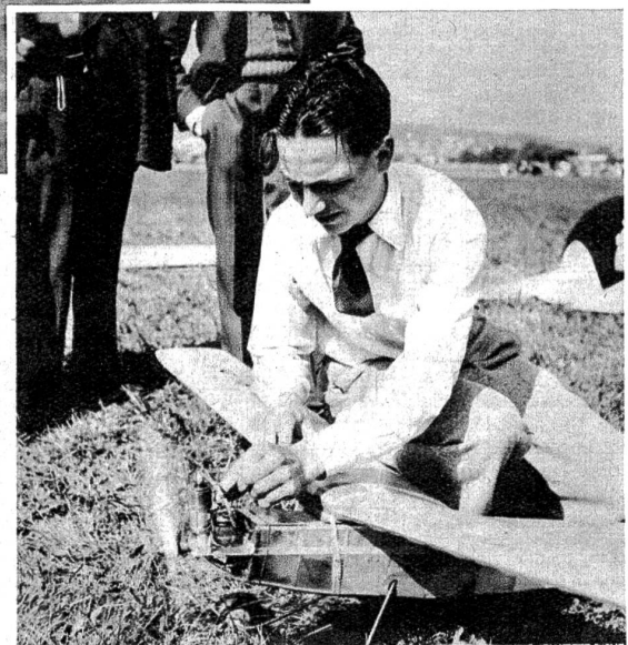
Dieser Einzwölfstel-PS-Motor hat die Aufgabe, das Flugzeug vom Boden auf in die Höhe zu führen. Nach einer gewissen Zeit setzt die motorisierte Antriebskraft aus — und das Flugmodell bleibt dem freien Spiel der Windströmungen überlassen.