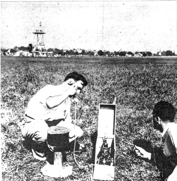
Soeben ist eine Landungsmeldung eingetroffen, die per Feldtelefon zum Turm weitergeleitet und dort durch den Lautsprecher verkündet wird.