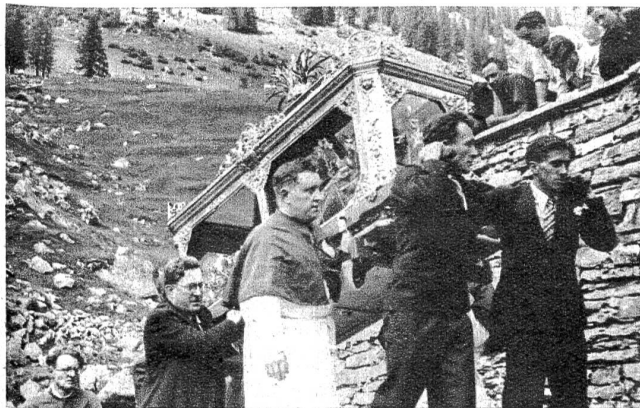
Der Heilige Theodor: ein römischer Märtyrer aus den Katakomben in Rom. Der mit Gold und edlen Steinen reich geschmückte Sarg des Heiligen wurde im Jahre 1938 anlässlich des 250. Jahrestages seiner Ueberführung in die Kirche von Bosco, in der feierlichen Prozession mitgetragen.