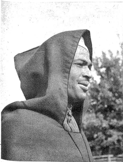
Typischer Spahikopf im leuchtendroten Reitermantel, der diesen an wärmeres Klima gewöhnten Leuten nicht nur Schutz, sondern auch noch ein besonders farbenprächtiges Aussehen gibt.