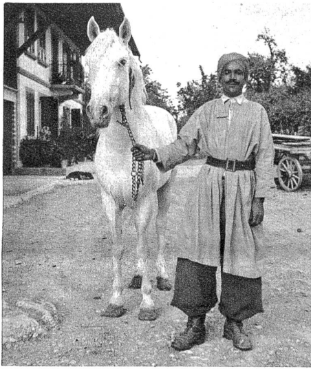
Die Spahis sind ausgezeichnete Reiter, die mit ihren Pferden treue Kameradschaft halten. Keiner hätte sich je zum Schlafen niedergelegt — auch in den aufgeregten Nächten des Grenzübertrittes nicht — bevor er nicht zuerst sein Pferd gefüttert und besorgt hatte. Die Pferde gehorchen oft aufs Wort.