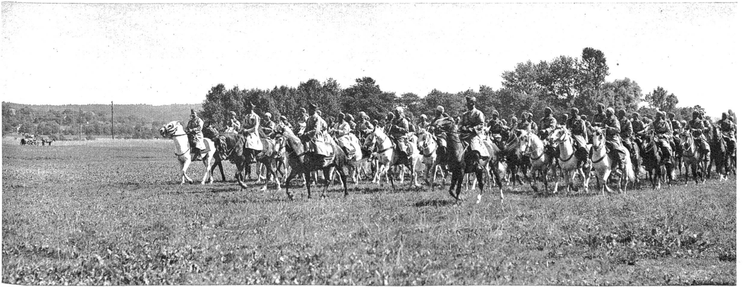
Spahis im Aufmarsch zu einer „Fantasia“, dem festlichen Reiterturnier dieser marokkanischen Eingeborenentruppe.