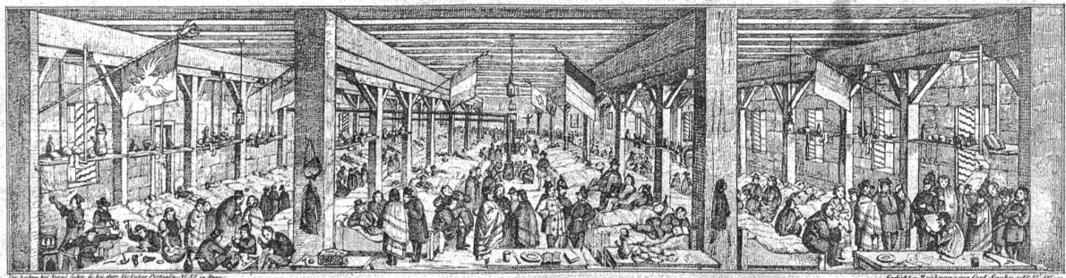
Großer Flüchtlings-Saal im Kornhaus in Bern, Januar 1850. Le Salon des réfugiés

Deutsche Flüchtlinge 1849. Das Jahr 1849 hatte der Schweiz eine Masse deutscher Flüchtlinge gebracht. Die Zahl der Schutz und Asyl Suchenden belief sich auf über 11,000. Es waren zum grössten Teil flüchtende Badenser, die sich am revolutionären Aufstand gegen ihre Regierung beteiligt hatten. Daneben waren auch viele Pfälzer, deren gleichzeitiger Aufstand gegen Preussen durch die deutschen Bundestruppen niedergeschlagen worden war. 230 Hassauer Flüchtlinge wurden auf dem Boden des grossen Kornhauses in Bern einquartiert, unter ihnen viele Handwerker, die sich für republikanische Freiheit begeistert und zum Aufstand hatten hinreissen lassen. Sie bereiteten der Eidgenossenschaft später aussenpolitische Unannehmlichkeiten und ihre zuerst begeisterte Aufnahme wich bald einmal dem Gefühl des Ueberdrusses gegen die viel disputierenden und kannegiessenden fremden „Nassauer“ und „Hassauer“. Trotzdem haben sich viele unter ihnen in der Schweiz eingelebt und ihre Nachkommen gehören heute zu den angesehensten Schweizerbürgern.