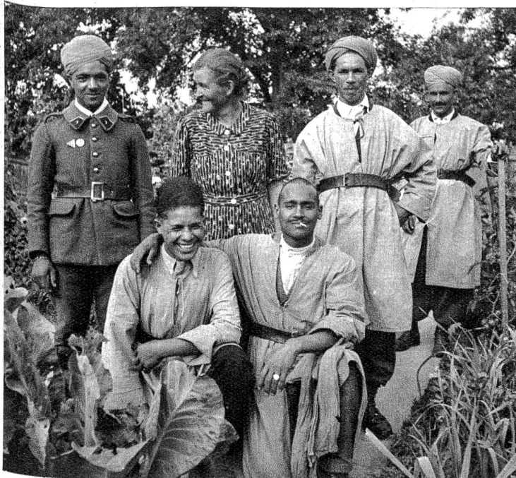
Eine Gruppe von Spahis in ihren gelben Reitermänteln, in der Mitte ihre „Pensionsmutter“, der sie wie aufs Kommando gehorchten. Es sind meist fröhliche liebenswürdige Gesellen, die sich recht gut aufführen.