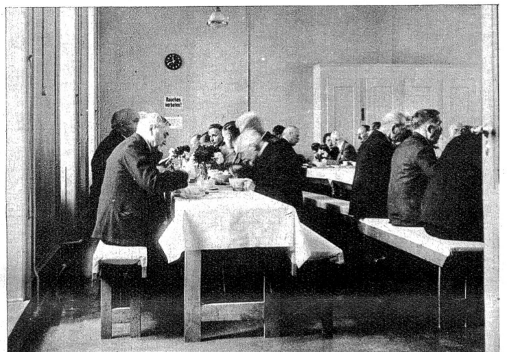
Im ehemaligen „Bernerhof“ hat der Verband „Volksdienst“ für die Bundesbeamten einen ausgezeichnet funktionierenden Zwischenverpflegungs-Service organisiert. In drei halbstündigen Schichten werden da in der Mittagspause für wenig Geld Suppe, warme Würste, Tee, Kaffee, Früchte, Kuchen und Gebäck verkauft und an Ort und Stelle verzehrt. So kommt es, dass ausnahmsweise im Bundeshaus fast so heiss gegessen wie gekocht wird.