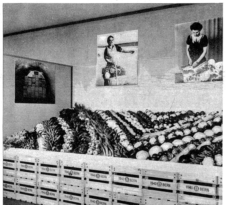
Angesichts dieser verlockenden Gemüseschau fällt es einem leicht mit besten Vorsätzen die Forderung „Esst dreimal mehr Gemüse“ zu beherzigen.

Mit offensichtlich gutem Erfolg wurde kürzlich in der Schulwarte die „Grüne Woche“ durchgeführt, eine Propaganda-Schau unserer einheimischen Volksnahrungsmittel. Kurse, Demonstrationen und belehrende Vorträge mit praktischen Beispielen zeigten unseren Hausfrauen, wie man gerade in schwerer Zeit aus dem was man hat das Beste herausholen kann. Unser obenstehendes Bild zeigt die lächelnde Farbenpracht unseres einheimischen Obstes, das in praktischen Einheitsharassen verpackt auf den Markt kommt. Hoffentlich verschwindet bald einmal auch die gedankenlose Unsitte auf unserem Markt, das Obst wie Kartoffeln zu behandeln, so dass man es fast als eine Seltenheit ansehen muss, unverbeulte Äpfel einzukaufen. Äpfel sollten wie Eier behandelt werden und nicht wie Holztütschi!