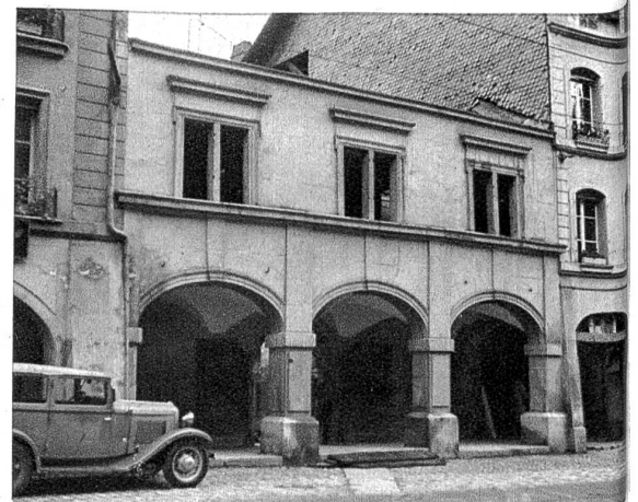
Die Schaal von der Kramgass-Seite. Der wohlproportionierte Aufbau über der Laube wurde 1666 errichtet.