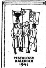
PESTALOZZI KALENDER 1941