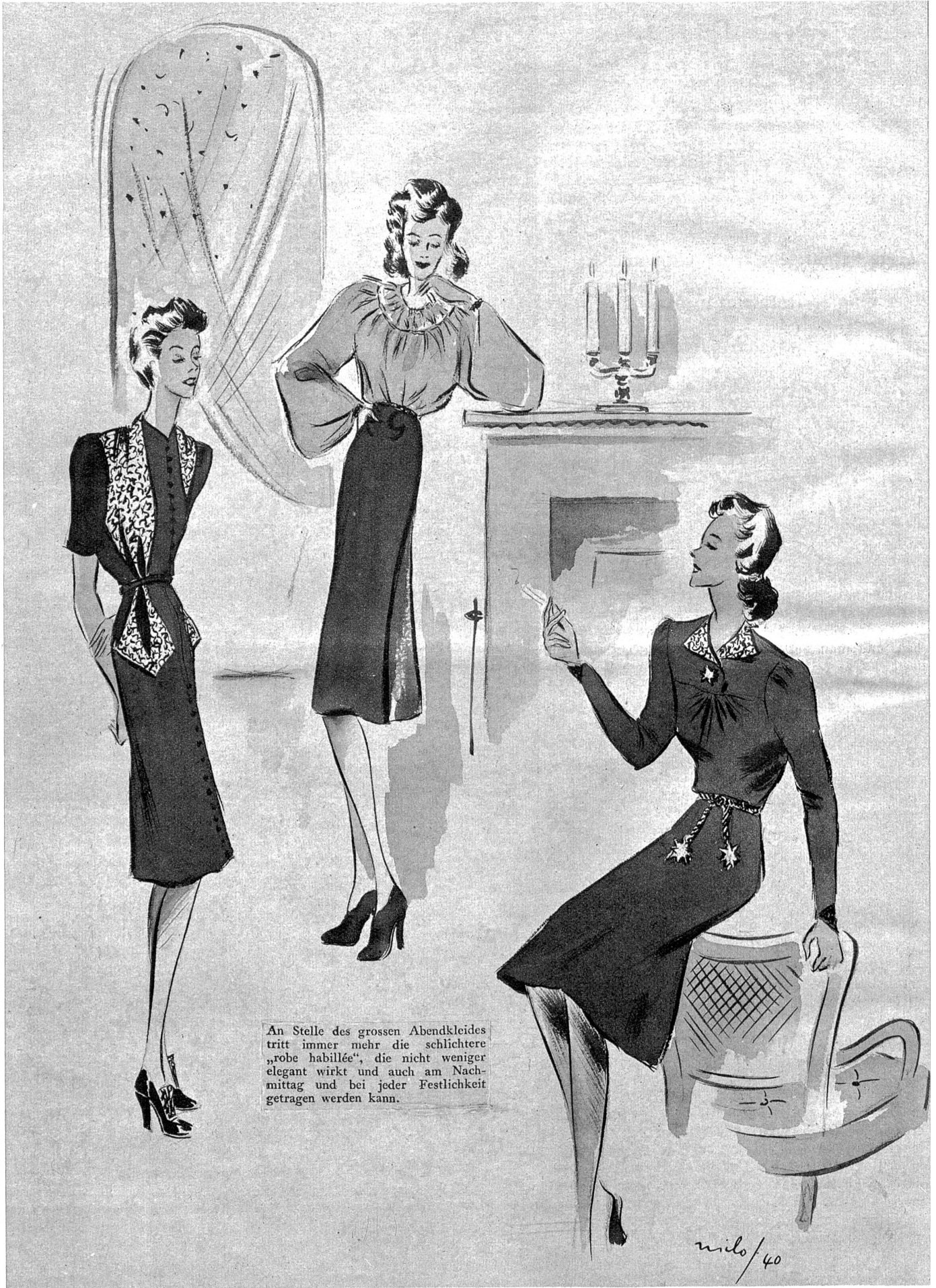
An Stelle des grossen Abendkleides tritt immer mehr die schlichere „robe habillée“, die nicht weniger elegant wirkt und auch am Nachmittag und bei jeder Festlichkeit getragen werden kann.