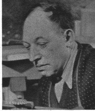
† Valentin Frankenstein