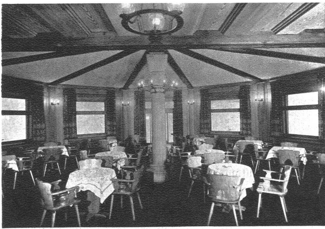
Hotel Riffelberg (2585 m ü. M.) Die halbkreisförmige neue Halle mit den grossen Aussichtsfenstern, die einen Rundblick auf die Walliser Viertausender ermöglichen. Beim Um- und Neubau dieses aus dem Jahre 1854 stammenden, heute (wie noch andere Hotels) der Zermatter Burgergemeinde gehörenden hochgelegenen Gasthauses sind in reichem Masse und in glücklicher Verbindung mit dem Mauerwerk einheimische Holzarten - Arve, Lärche, Esche, Tanne - zur Verwendung gekommen.