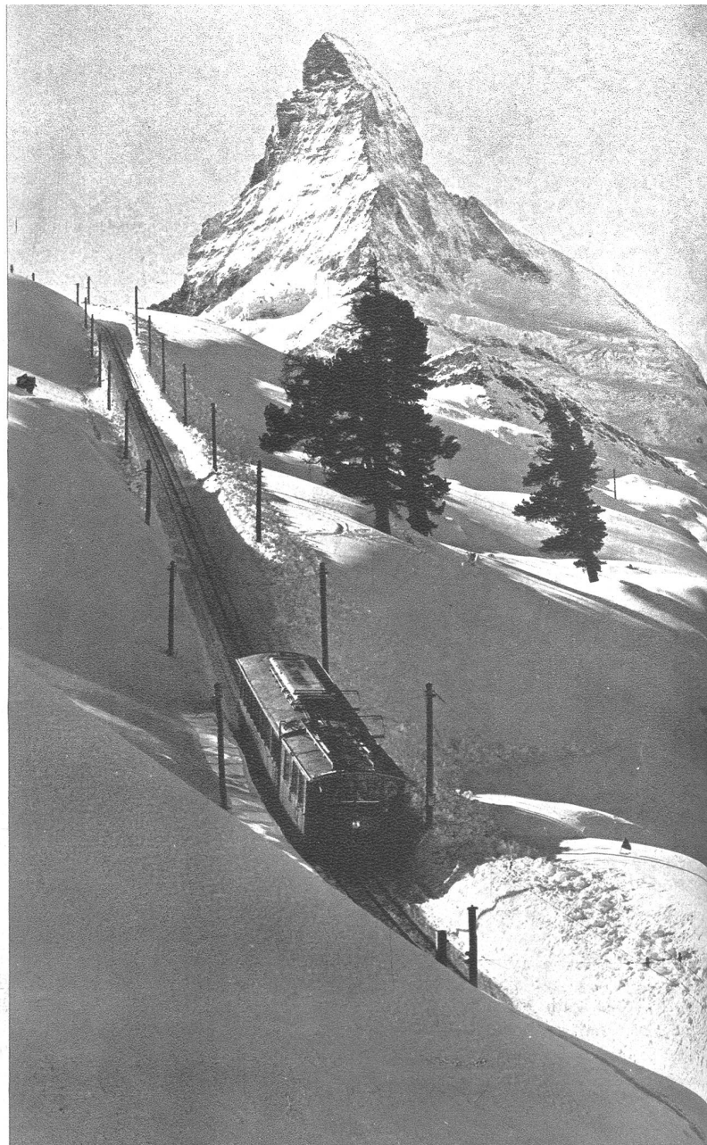
Zermatt, Gornergratbahn auf Riffelalp, Matterhorn.