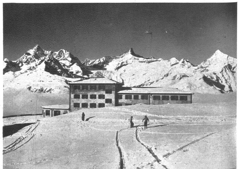
Ein idealer Ausgangspunkt für hochalpine Skitouren: Das umgebaute und neueröffnete Hotel Riffelberg ob Zermatt, 2585 m ü. M. In diesem Winter fährt die Gornergratbahn erstmals durch die am lawinengefährlichen Steilhang ob Riffelboden erstellten 770 m lange Schutzgalerie bis auf Riffelberg, wo der Skifahrer auch ein prächtiges, von den Walliser Viertausendern umstandenes Übungsgelände findet und in dem ebenso heimeligen wie komfortablen neuen Berghaus gut aufgehoben ist.