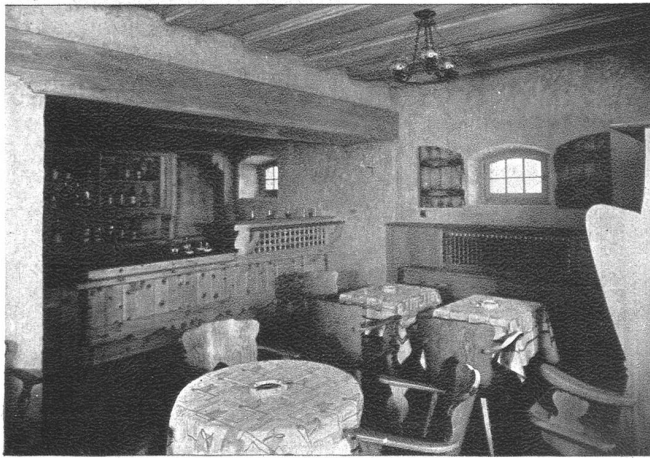
Eine gemütliche Ecke in der neuen Halle des Hotels Riffelberg.