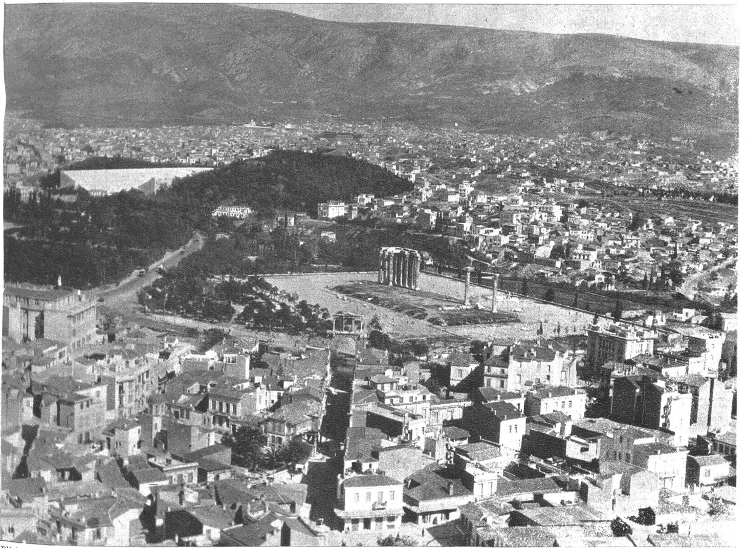
Blick auf Athen von der Akropolis, des durch Kunstwerke und Prachtbauten ausgezeichneten militärischen und religiösen Mittelpunkts der Stadt, des Griechentums, ja einstmals der menschlichen Kultur überhaupt. In der Mitte das Olympieion, ein vom römischen Kaiser Hadrian im Jahre 129 n. Chr. erbauter Tempel zu Ehren des olympischen Zeus, — davor als Abschluss der Strasse das Hadriansthor, ein Triumphbogen, den er sich selbst zu Ehren gebaut hatte. Links im Hintergrund das alte griechische Stadion, das vielen Tausenden Platz bot. Athen, einst das Kulturzentrum der abendländischen Menschheit, ist wieder vom Krieg erfasst!