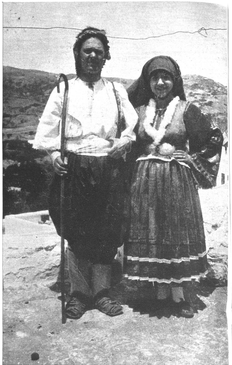
Griechische Volkstypen in der Landstracht.