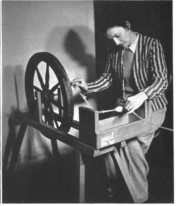
Am Spulrad beim Aufspulen des Garns.