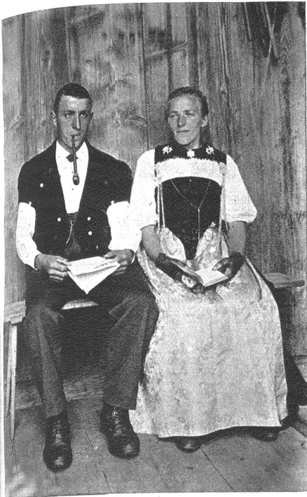
Sigriswiler Bauernpaar in der Tracht. Aufgenommen im Jahre 1906.