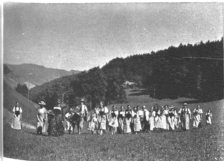
Die Trachtengruppe Langenthal auf einem Trachtenausflug.