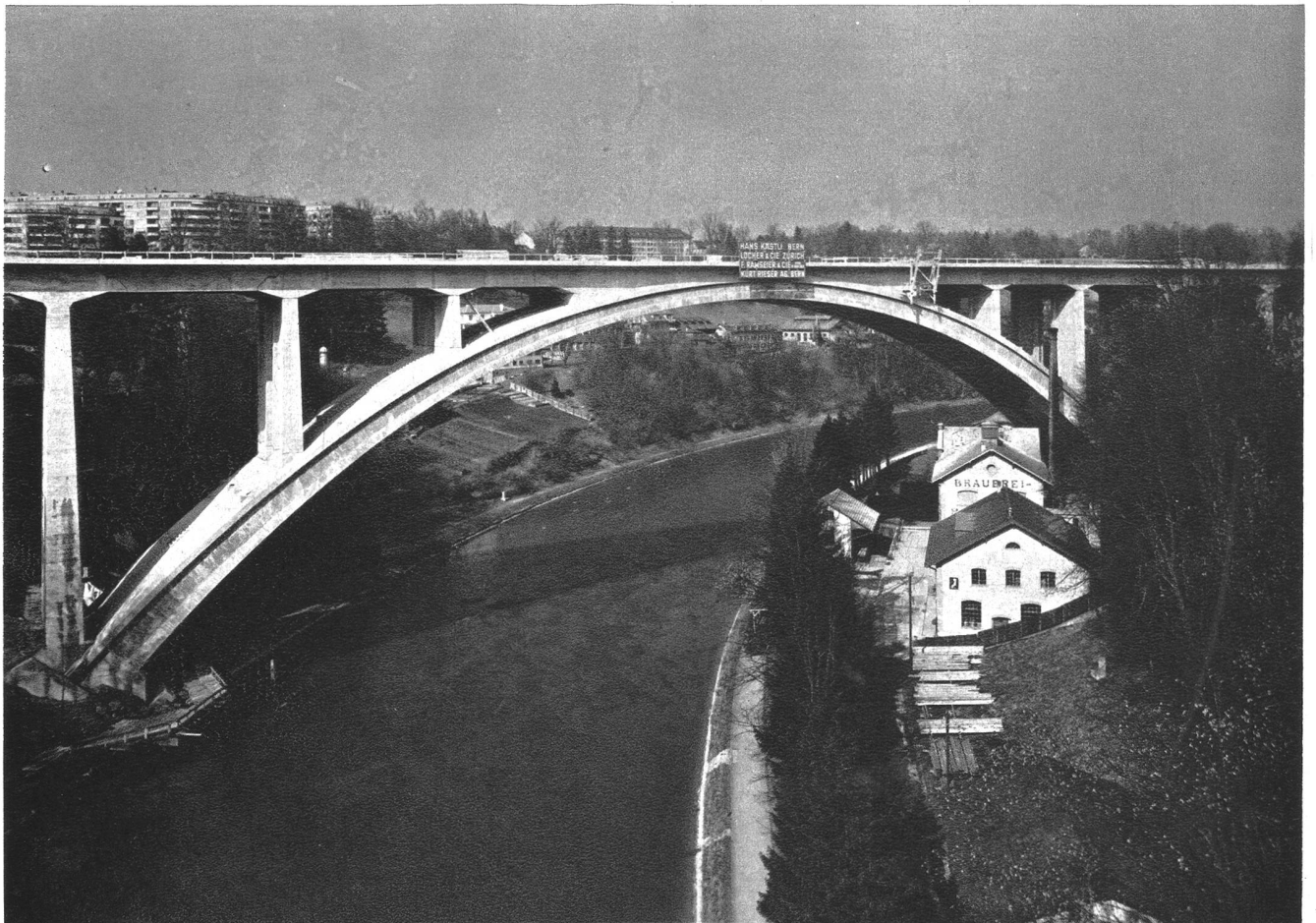
Eines der grössten Bauwerke der Stadt Bern, die neue Eisenbahnbrücke, geht diesen Sommer ihrer Vollendung entgegen.

an der Stelle des alten Naturhistorischen Museums an der Genfergasse-Ferdinand-Hodler-Strasse.