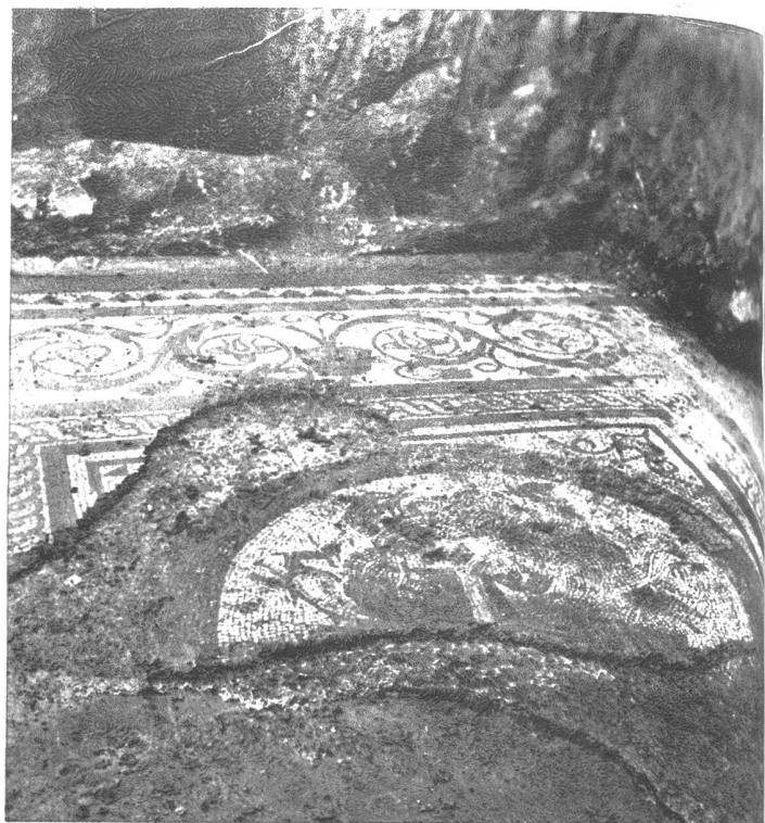
Die Ausgrabungsstätte in Münsingen, wo man die Ueberreste eines alten Herrenhauses freigelegt hatte.