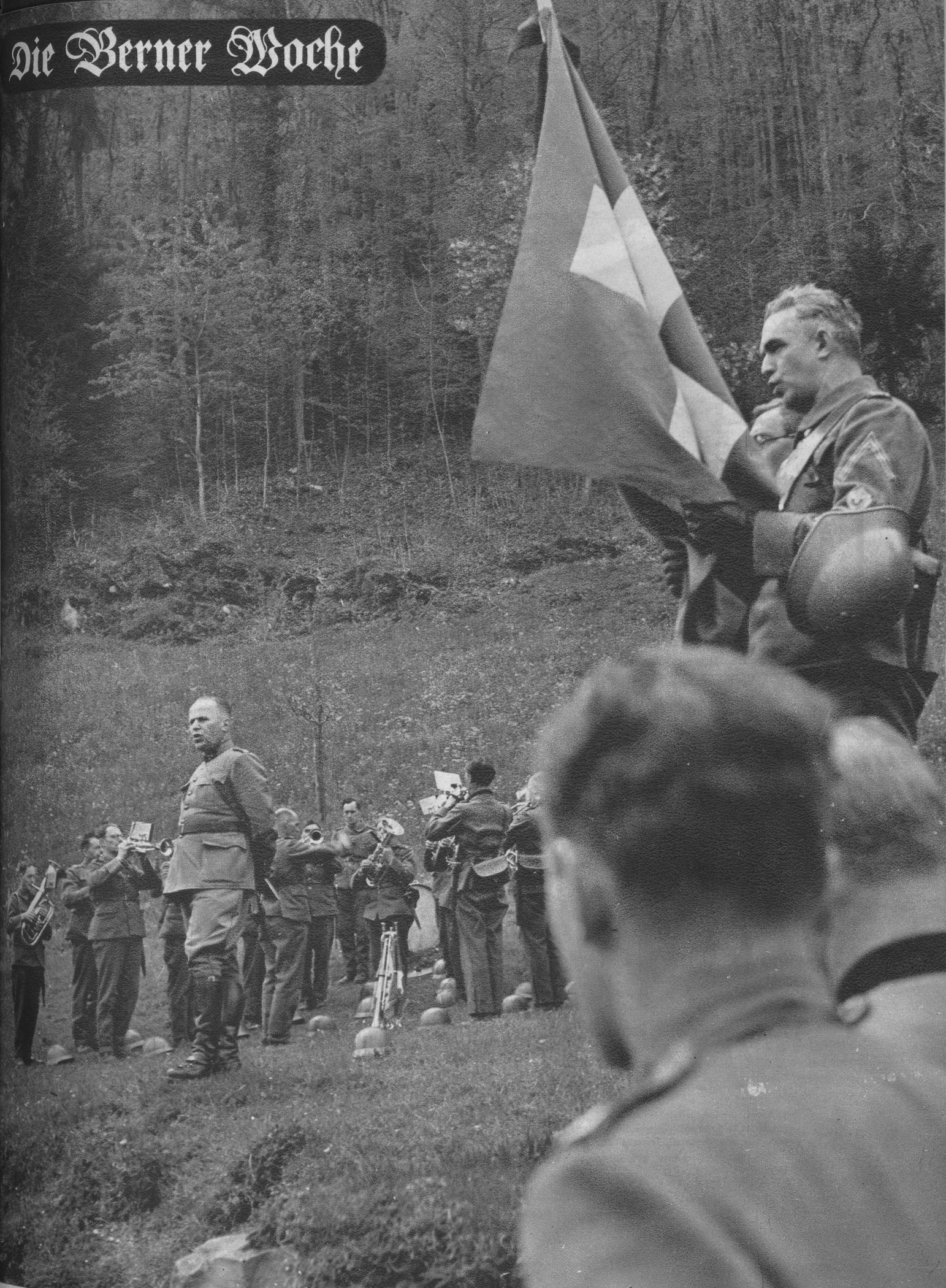
Berner Soldaten um die Fahne geschart, am Rütli