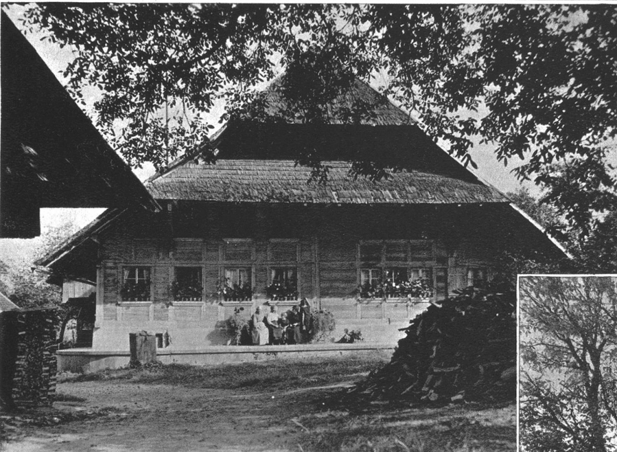
Ein Bauernhaus in Steckholz.