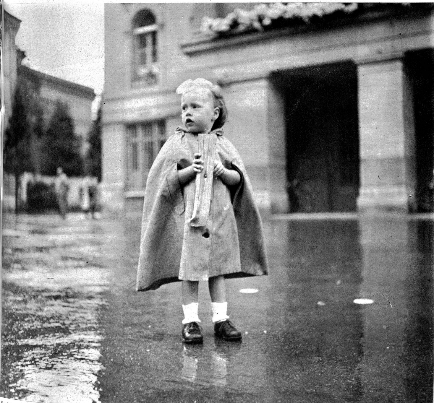
Recht zaghaft wandert der Blick dieser Kleinen über den grossen Platz zum Scheiterhaufen.