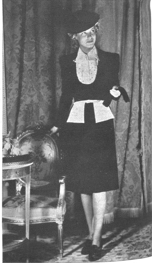
Das Nachmittagskleid mit weisser St. Galler Stickerei zeigt in der Lini die ausgesprochene Eleganz.