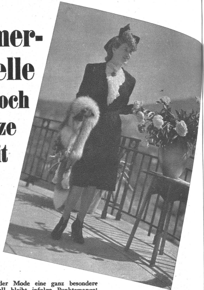
Ein dunkler Tailleur wirkt immer elegant, besonders wenn die Wirkung durch eine weisse Spitzenbluse erhöht wird.

Auch in den schweren Zeiten kommt der Mode eine ganz besondere Bedeutung zu und manches schöne Modell bleibt infolge Punktemangel nur ein Ansichtsstück, ohne seine Bestimmung erfüllen zu können. — Die Firma Scheidegger hat sich deshalb entschlossen, die fertigen Modelle, soweit sie nicht beansprucht werden, ohne Punkte abzugeben, ohne Rücksicht auf das Material.