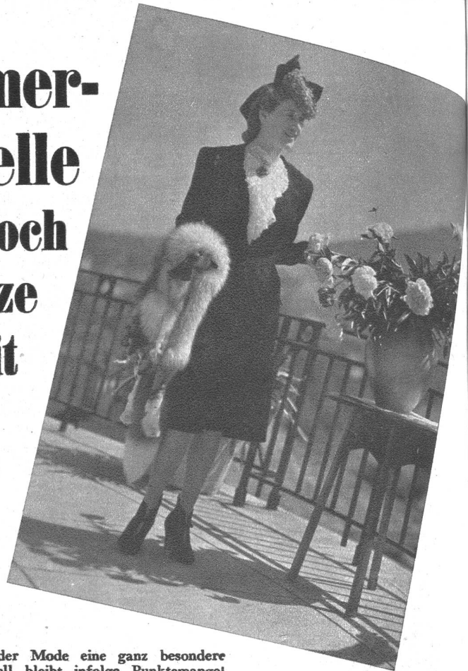
Ein dunkler Tailleur wirkt immer elegant, besonders wenn die Wirkung durch eine weisse Spitzenbluse erhöht wird.

Auch in den schweren Zeiten kommt der Mode eine ganz besondere Bedeutung zu und manches schöne Modell bleibt infolge Punktemangel nur ein Ansichtsstück, ohne seine Bestimmung erfüllen zu können. — Die Firma Scheidegger hat sich deshalb entschlossen, die fertigen Modelle, soweit sie nicht beansprucht werden, ohne Punkte abzugeben, ohne Rücksicht auf das Material.