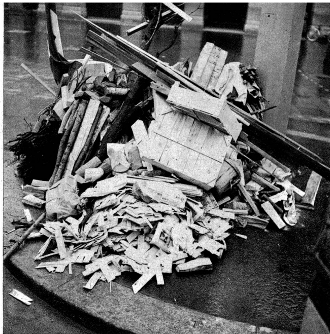
Der Anfang ist gemacht, der Holzhaufen wächst sichtbar in die Höhe.