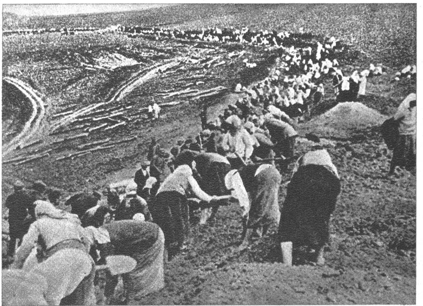
Timoschenko bereitet hinter dem Dnjestr neue Stellungen vor, bei deren Ausbau jede verfügbare Kraft herangezogen wird, auch Frauen.