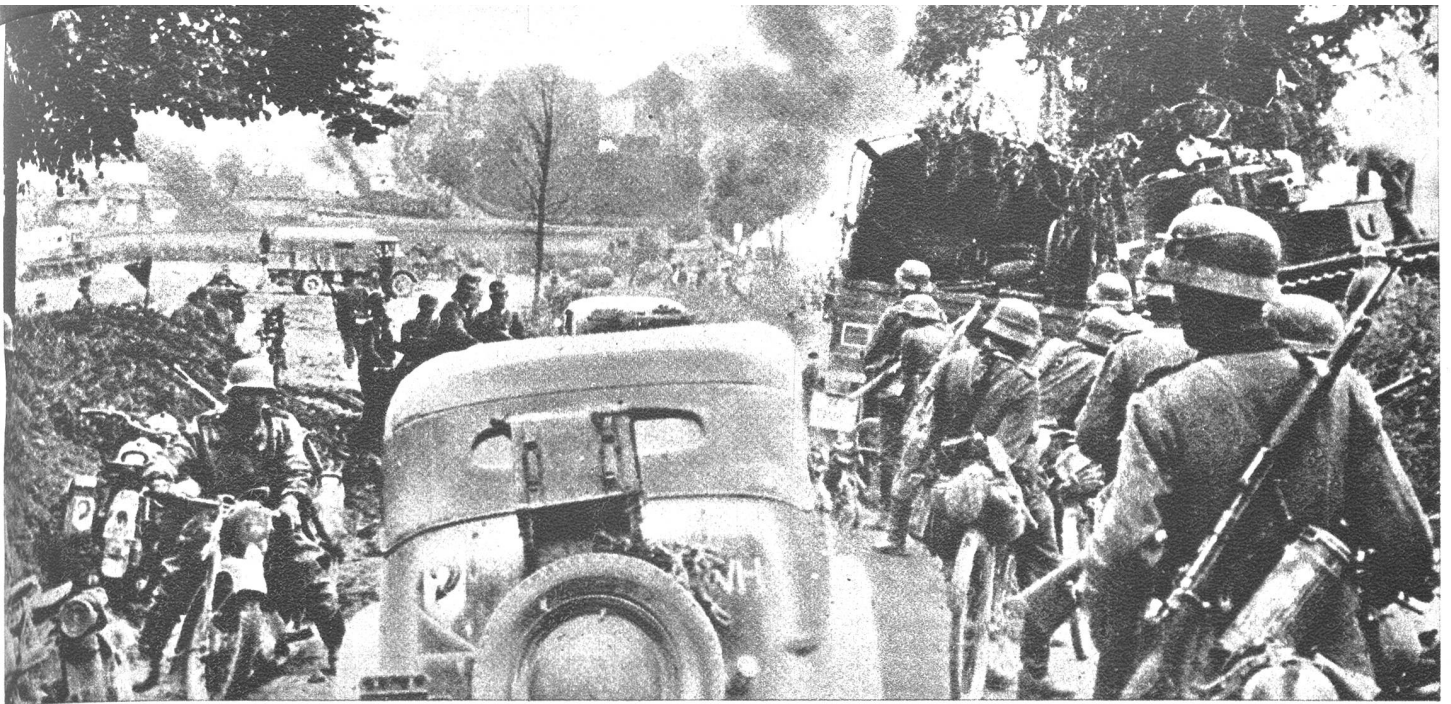
Der Vormarsch der deutschen Kolonnen führt durch Schutt und Brand und stellt enorme Anforderungen an Mann und Material.