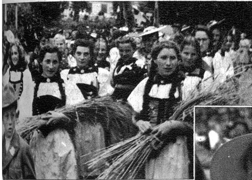
Die reife Frucht unserer Erde tragen junge Mädchen und weisen bildhaft darauf hin, dass diese in ihren Händen gut aufgehoben ist.