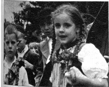
Glückliche Kinder — sie erleben den Umzug als ein grosses Geschehen.