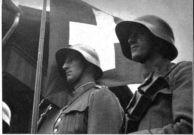
Ueber allem stand das Zeichen des Vaterlandes, von strammen Soldaten bewacht.