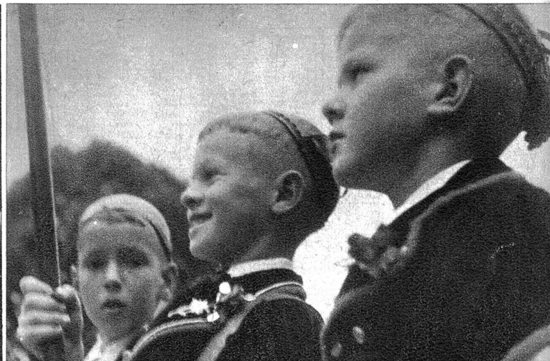
Stramme Eurschen und fröhliche Fahnenräger gaben dem Fest ein besonderes Gepräge.