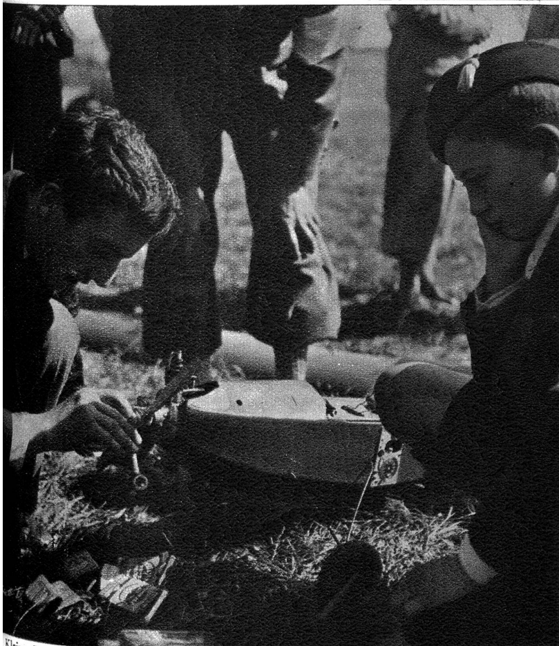
Kleine Reparaturen werden am Startplatz rasch und genau vorgenommen, wie es eben einem zukünftigen Konstrukteur geziemt.