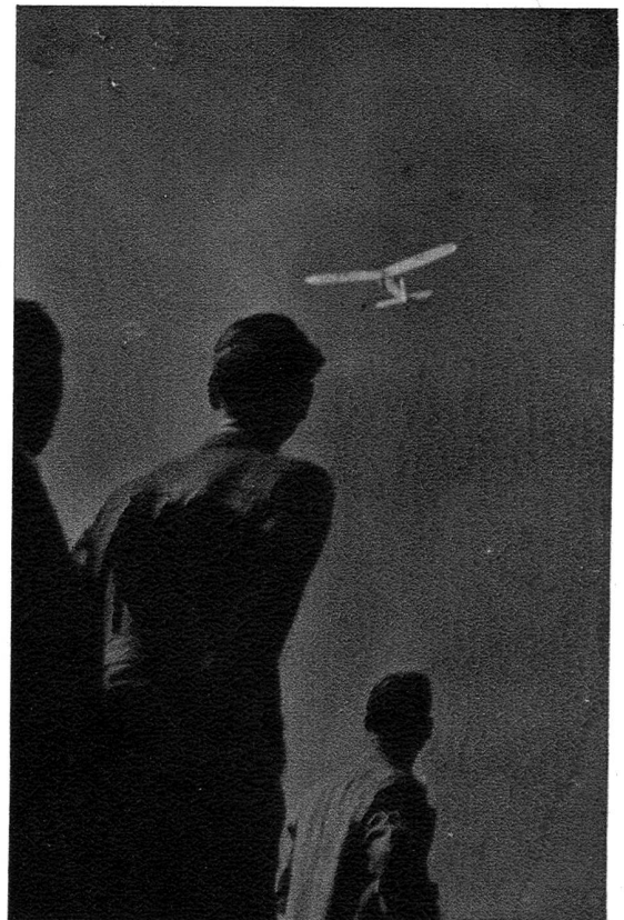
Spielend leicht erhebt sich ein gut konstruiertes Modell und schwebt wie ein weisser Vogel in den Lüften.